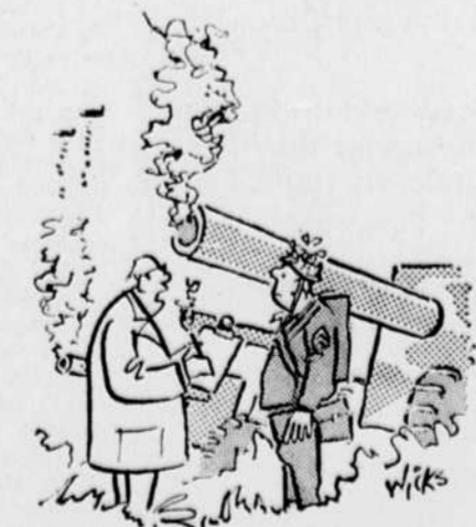
"Je viens pour contrôler la pollution de l'air..."