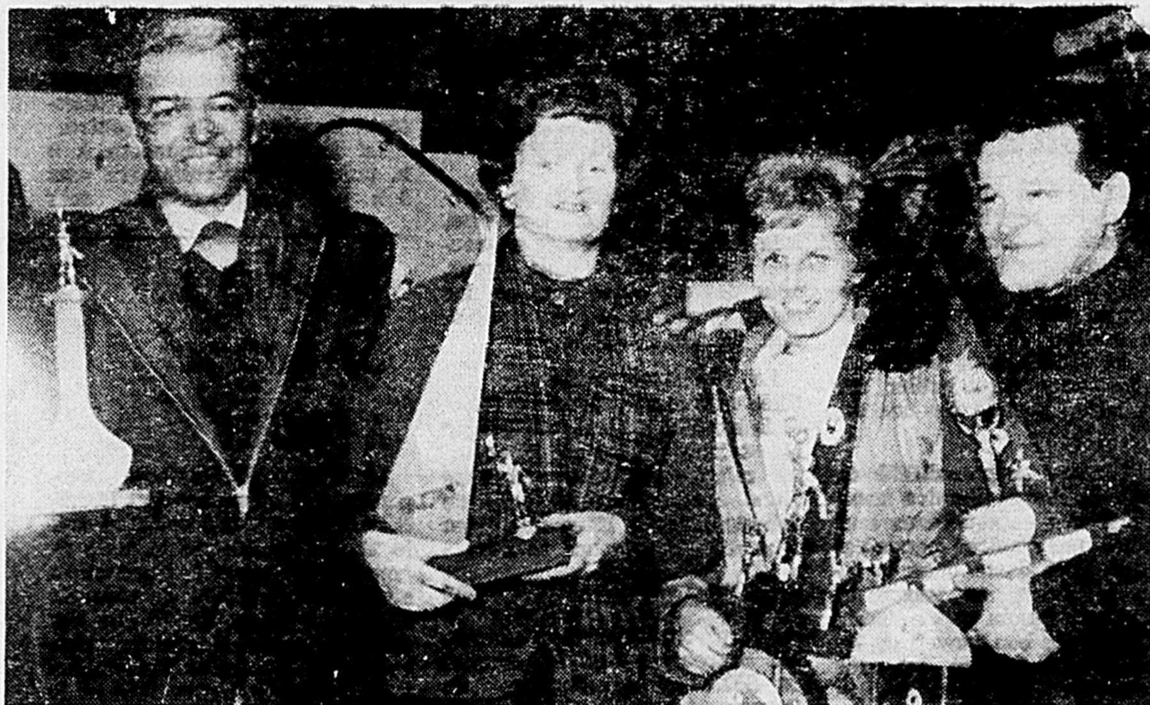
CHAMPIONS DE COURSES EN TRAINAUX-MOBILES

Pourquoi PAYER PLUS CHER quand L'Action POPULAIRE vous offre PLUS DE NOUVELLES que tout autre dans la région