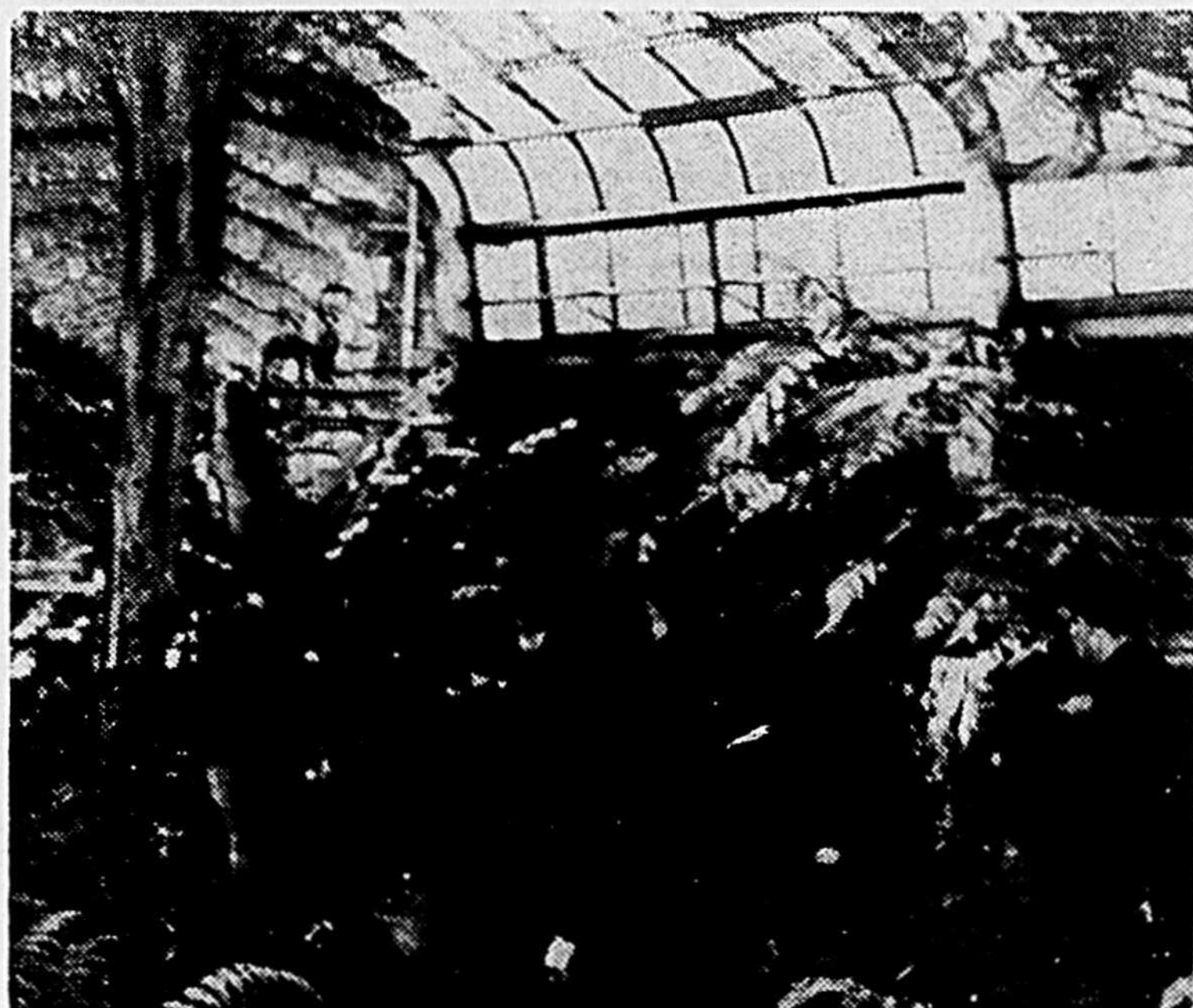
Si la route est efficace, elle ne fait pas de bruit, elle est peu voyante... a preuve, où sont les 4 routiers sur la photo?... Le Jardin Botanique de Montréal était sur notre route.

Oui, c'est une découverte réalisée par la jeune route du Clan Laurentien. Le problème était le suivant: pour visiter Montréal, pouvons nous partir à l'aventure dans cette ville en suivant notre sentier?