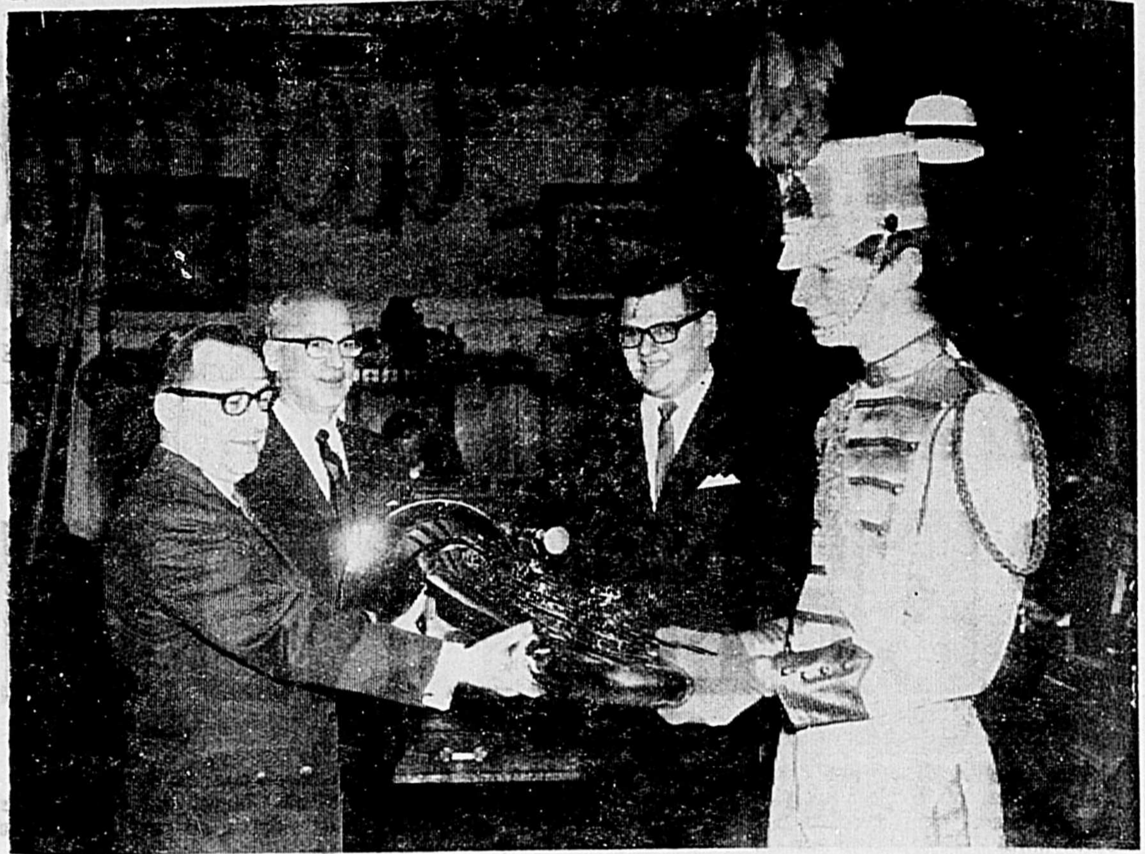
LA CITE OFFRE UNE CONTREBASSE AUX SENATEURS