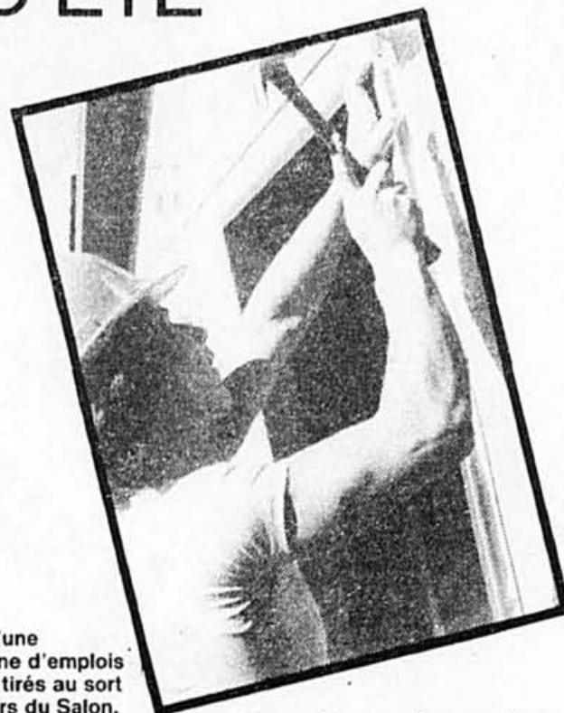
Près d'une trentaine d'emplois seront tirés au sort au cours du Salon.

Voici les noms des entreprises qui participent à ce tirage au sort et qui sont toutes