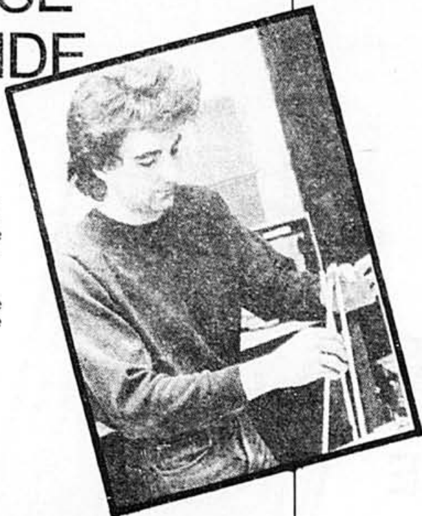
Un jeune artiste travaille à la maquette de la sculpture.

Tous les étudiants en arts de l'Université de Montréal travailleront à sa réalisation sous la direction de leurs professeurs. Hydro-Québec, en plus de commanditer la réalisation du projet, a offert aux jeunes sculpteurs des matériaux originellement