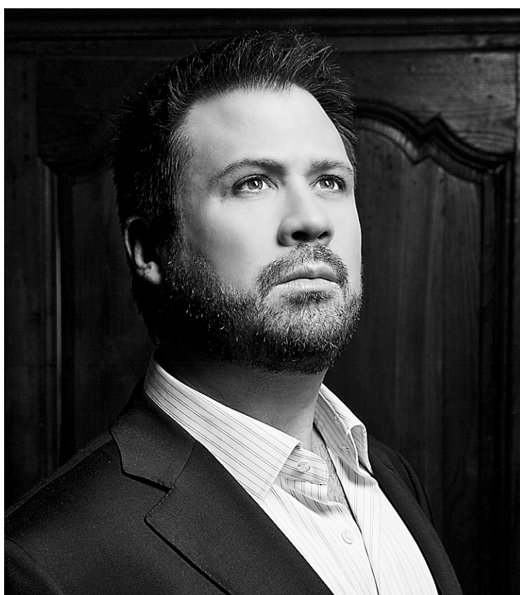
Le haute-contre David Daniels chante Bach et Handel au Festival Bach jeudi, 19 h 30, à St. Andrew and St. Paul.