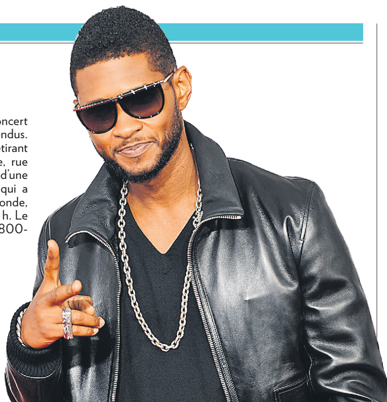
Usher

Usher est en ville et les billets de son concert au Centre Bell sont évidemment tous vendus. Mais les fans peuvent se reprendre en étirant la soirée à la boîte de nuit La Mouche, rue Saint-Denis. Le musicien sera l'hôte d'une soirée ouverte au public. Le chanteur, qui a vendu 35 millions d'albums dans le monde, devrait se montrer le bout du nez vers 23h. Le prix des billets est fixé à 45$. Infos: 1-800-347-9958.