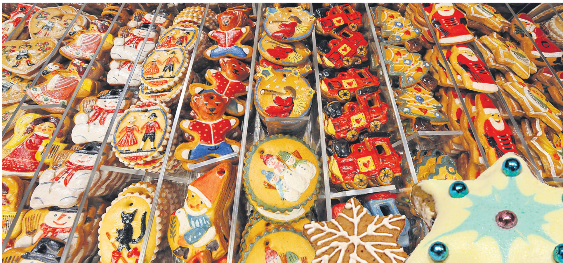
Pains d'épices traditionnels : un des délices sucrés du temps des Fêtes.