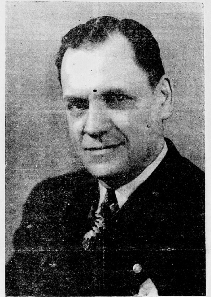
Monsieur Georges-Octave POULIN, réélu député de Beauce avec une majorité d'au-delà de 8,000 voix.