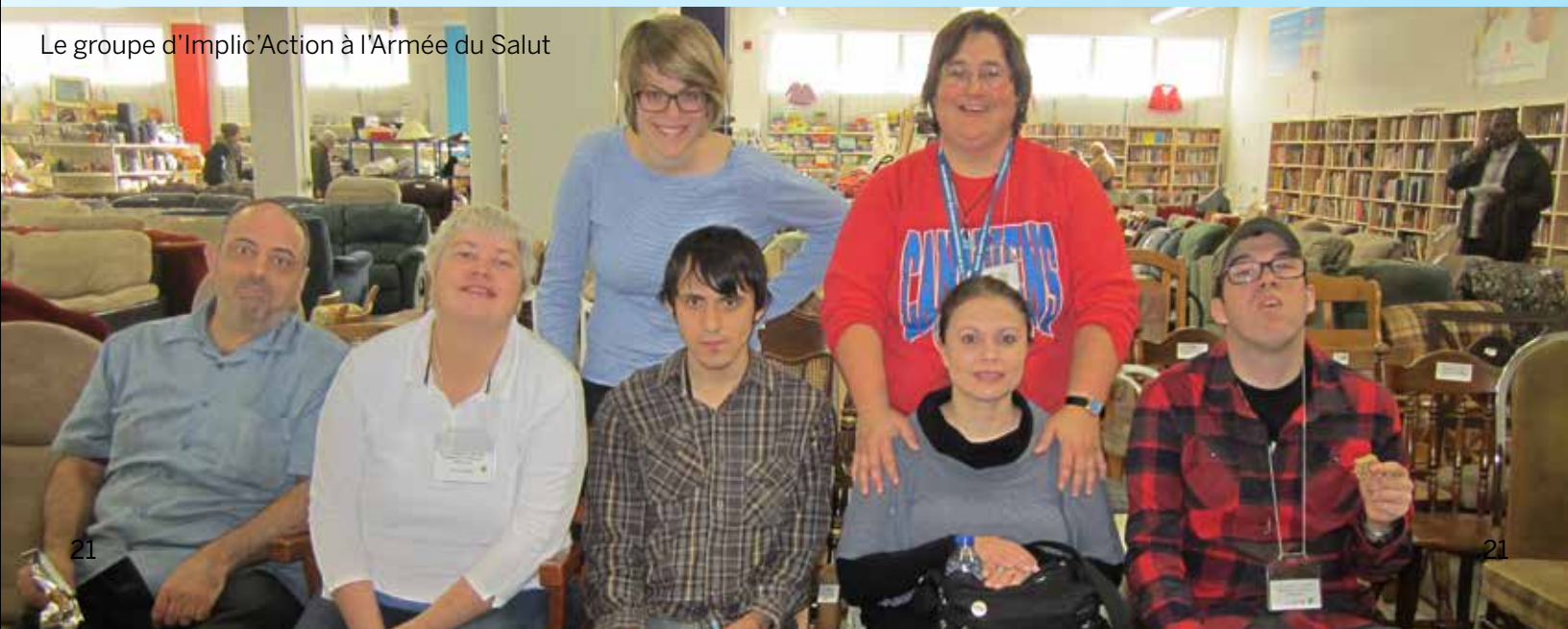
Le groupe d'Implic'Action à l'Armée du Salut

S'ajoute à cela une participation à des événements sur le thème de la déficience intellectuelle, tels que le Salon de Montréal des personnes à besoins spéciaux et le colloque du Réseau international sur le processus de production du handicap (RIPPH), au cours desquels nous avons exposé affiches et documentation en plus d'informer sur nos services. D'autres occasions ? L'exposition des œuvres des participants de l'atelier Explorations artistiques dans des endroits publics comme le Café de Da, le Bistro Jarry-Deuxième et la remise des Prix Janine-Sutto dans le cadre de l'événement multidisciplinaire D'un œil différent dans un lieu public hautement fréquenté, l'Écomusée du fier monde.