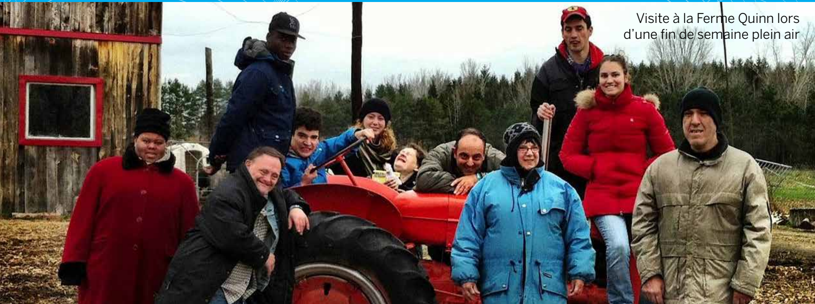
Visite à la Ferme Quinn lors d'une fin de semaine plein air

220 participants aux séjours extérieurs, ce qui équivaut au même nombre de familles qui ont pu bénéficier de moments de répit pendant que leur proche ayant une déficience intellectuelle développait ses habiletés