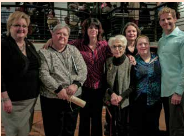
Lauréats des prix Janine-Sutto

L'AMDI souhaite être une vitrine sur la déficience intellectuelle et, en ce sens, nous prenons part à plusieurs événements durant l'année. C'est dans ce cadre que nous avons de nouveau fait partie du comité organisateur de la 9 e édition de l'événement D'un œil différent, le seul événement culturel multidisciplinaire rassemblant durant deux semaines des artistes avec ou sans déficience intellectuelle, amateurs, émergents ou professionnels. Une façon remarquable de souligner la Semaine québécoise de la déficience intellectuelle (SQDI) et de mettre en lumière le talent des personnes ayant une déficience intellectuelle. Cet événement rassembleur offre une grande visibilité auprès du grand public et a accueilli plus de 600 personnes à la soirée d'ouverture. Dans la programmation, l'accent a été mis sur les journées scolaires, dont le nombre a d'ailleurs doublé, dans le but de sensibiliser une génération montante.