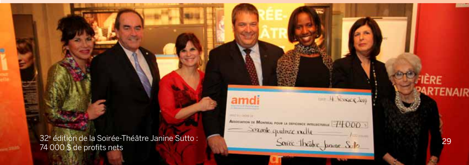
32 e édition de la Soirée-Théâtre Janine Sutto : 74 000 $ de profits nets