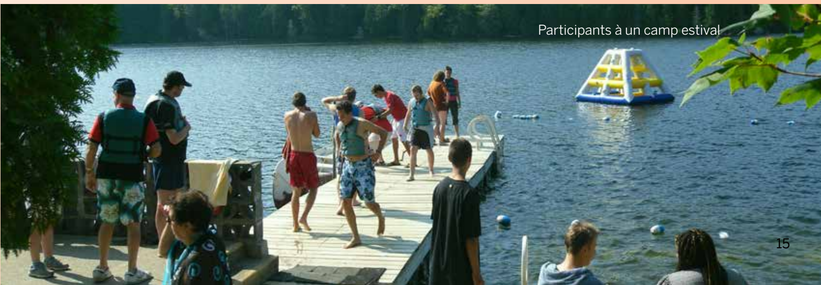
Participants à un camp estival

La pertinence des sujets abordés demeure évidemment le facteur décisionnel pour la participation des membres. Ainsi, tel que vous pourrez le lire dans la section sur le Vieillessement (page 17), les conférences organisées en collaboration avec d'autres organisations du milieu au sujet de l'hébergement des personnes ayant une déficience intellectuelle en lien avec le vieillissement ont connu un vif succès.