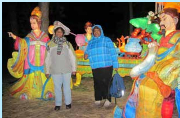
Sortie familiale - La magie des lanternes