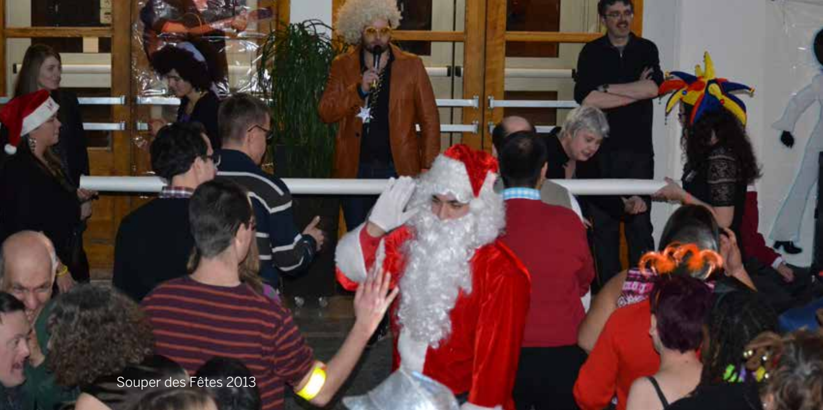
Souper des Fêtes 2013