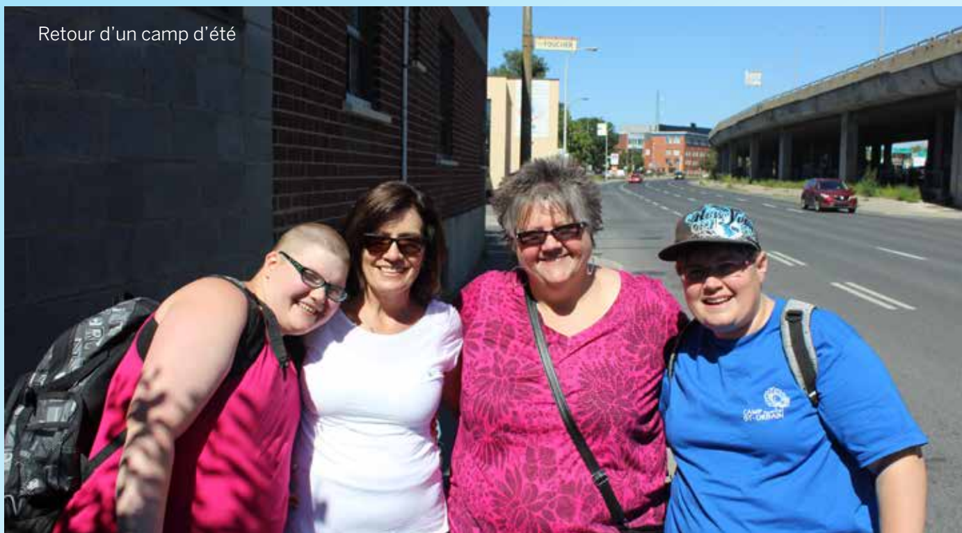
Retour d'un camp d'été

192 nouvelles vignettes d'accompagnement émises