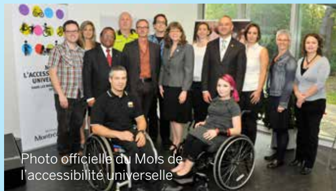
Photo officielle du Mois de l'accessibilité universelle

Pour une deuxième année consécutive, nous avons été impliqués dans le programme de porte-parole pour la campagne de financement de Centraide avec nos membres afin qu'ils représentent l'AMDI et la déficience intellectuelle auprès des entreprises sollicitées par Centraide.