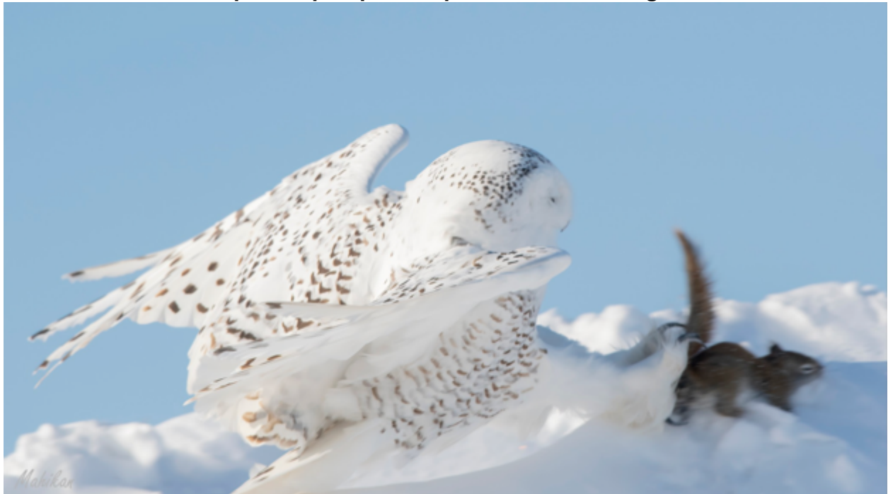
AdLibGoOiseaux / Janvier 2024