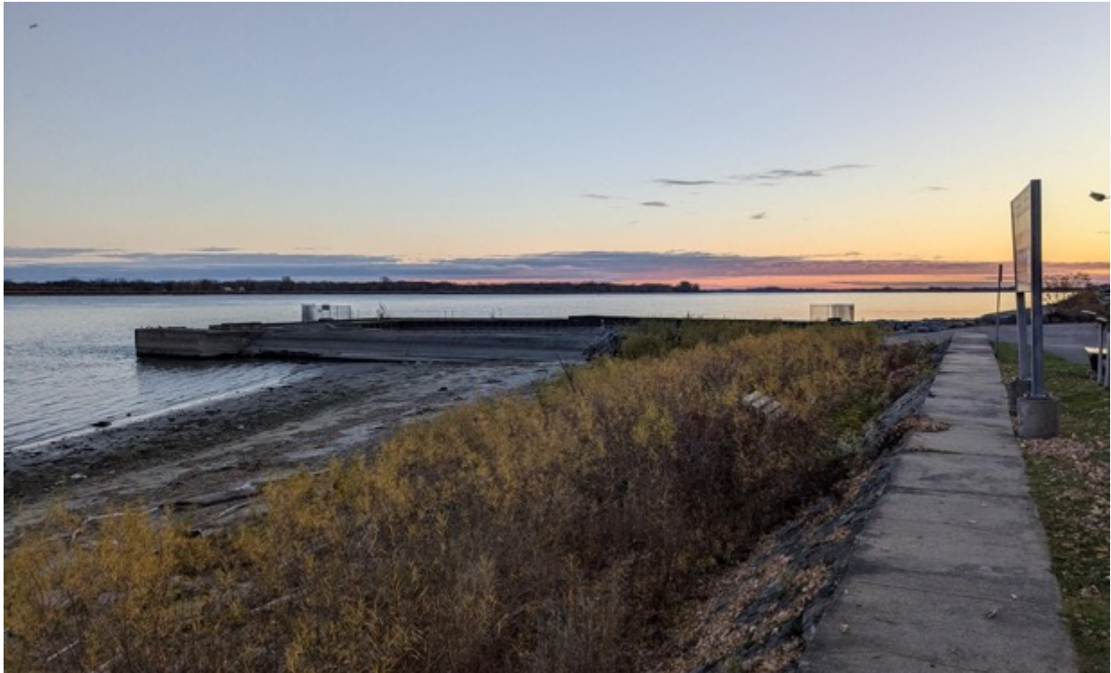
Le soleil se lève sur le quai de Ste-Anne

Sauf lorsque le niveau de l'eau est anormalement bas, il n'y a pas vraiment de plage. Ici le fleuve est large, et les canards passent souvent loin. Une lunette d'approche peut aider grandement à l'identification. Une autre option est de prendre des photos avec un téléobjectif et immédiatement regarder les images en les agrandissant. Lorsque le vent est bien présent et génère des vagues, ça peut devenir difficile de repérer et identifier un canard, un grèbe ou un huard qui plongent constamment. On observe fréquemment des rapaces à l'extrémité ouest de l'Île de Grâce un peu en aval.