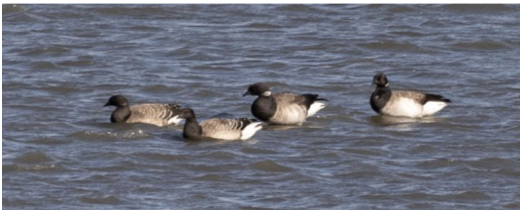
Bernache cravant - parc Regard-sur-le-Fleuve

Ce qu'on appelait jadis le quai de Ste-Anne, le parc Henri-Letendre se trouve à l'intersection de la rue de la Rive et de la rue du Quai, à Ste-Anne-de-Sorel. On y retrouve un grand stationnement gratuit, une toilette publique, et un espace gazonné agrémenté de bancs directement sur le bord du fleuve. C'est un site où l'observation se fait de façon statique : on débarque de l'auto, on installe notre lunette, et on observe.