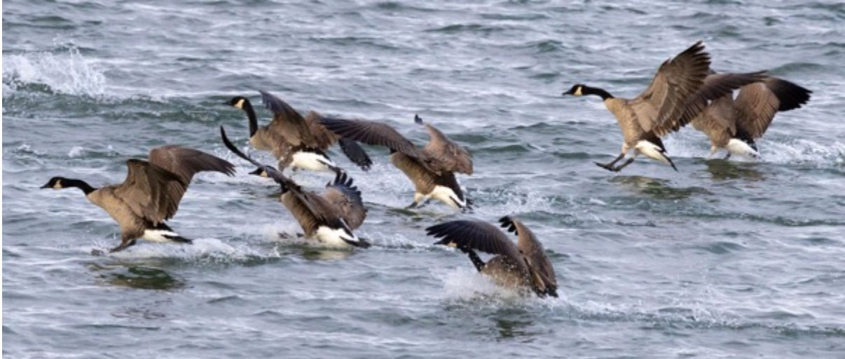
Bernaches du Canada qui se jettent à l'eau juste devant nous - parc Henri-Letendre