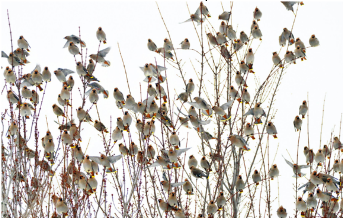
AdLibGoOiseaux / Photo de Clarence Gagné/ Janvier 2024