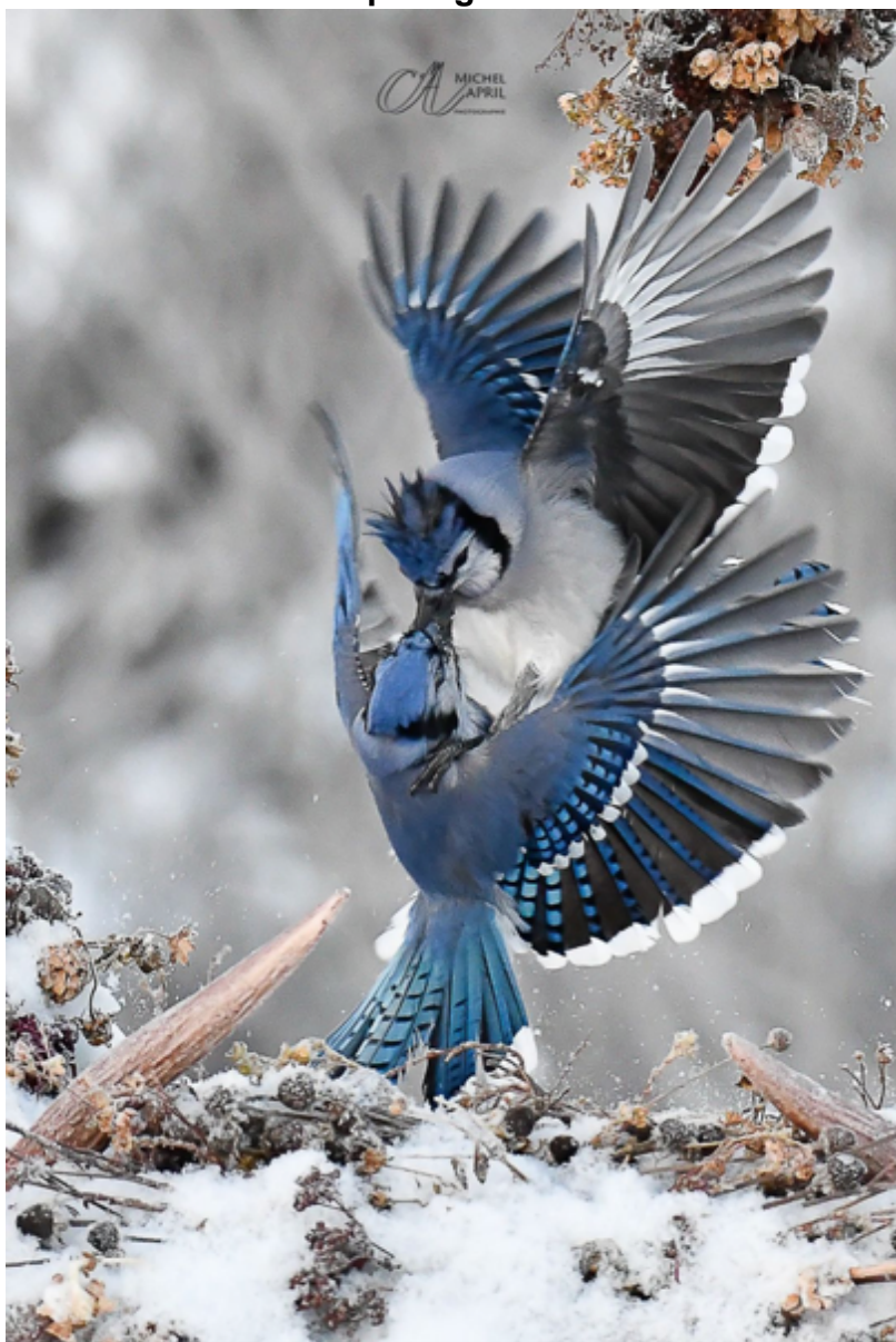
AdLibGoOiseaux / Janvier 2024