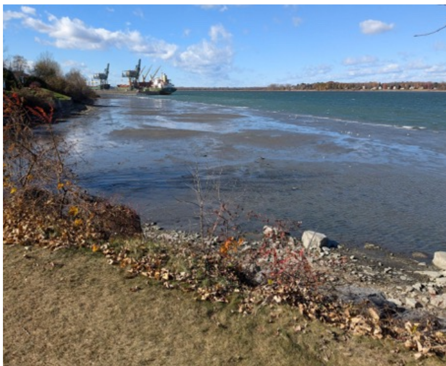
Vue sur la baie à l'ouest. Ici, le niveau du fleuve est anormalement bas.

Des 4 sites, c'est ici que le fleuve est le moins large : presque 2 fois moins qu'au parc Henri-Letendre (1,15 km vs 2 km). D'ici on a principalement 2 points de vue. Au bout du stationnement, à gauche, on a un point de vue surélevé sur le fleuve devant et à l'ouest. Ici aussi on a une baie, longue et étroite, entre le parc et le quai de Rio Tinto, un demi km à l'ouest. Plusieurs oiseaux (canards, oies, goélands, etc.) sont souvent observés dans cette baie peu profonde.