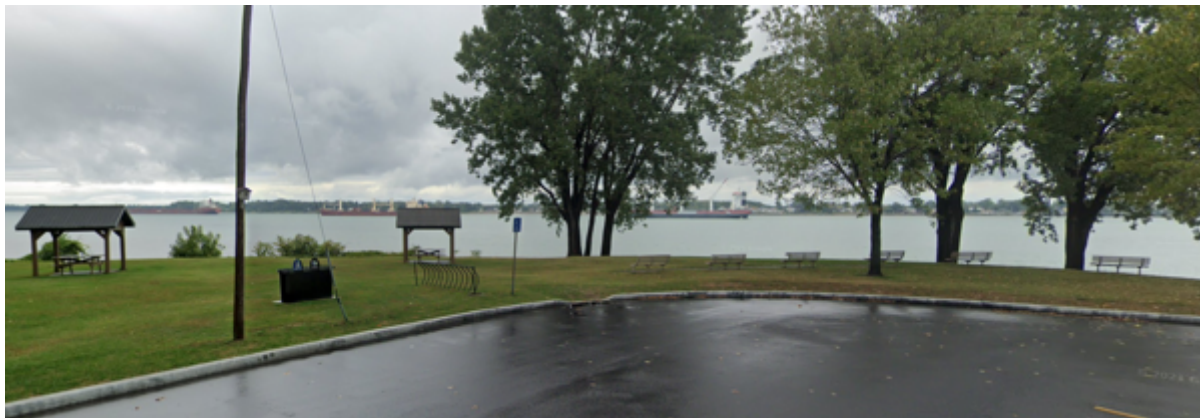
Les bancs face au fleuve, les abris de table à pique-nique.

passereaux. On y retrouve plusieurs bancs (qui font face au fleuve !) ainsi que plusieurs tables de pique-nique couvertes. Il y a aussi un grand kiosque couvert. On pourrait donc faire de l'observation en cas de pluie. Des toilettes sont également présentes dans le parc. Le stationnement est suffisamment vaste et gratuit.