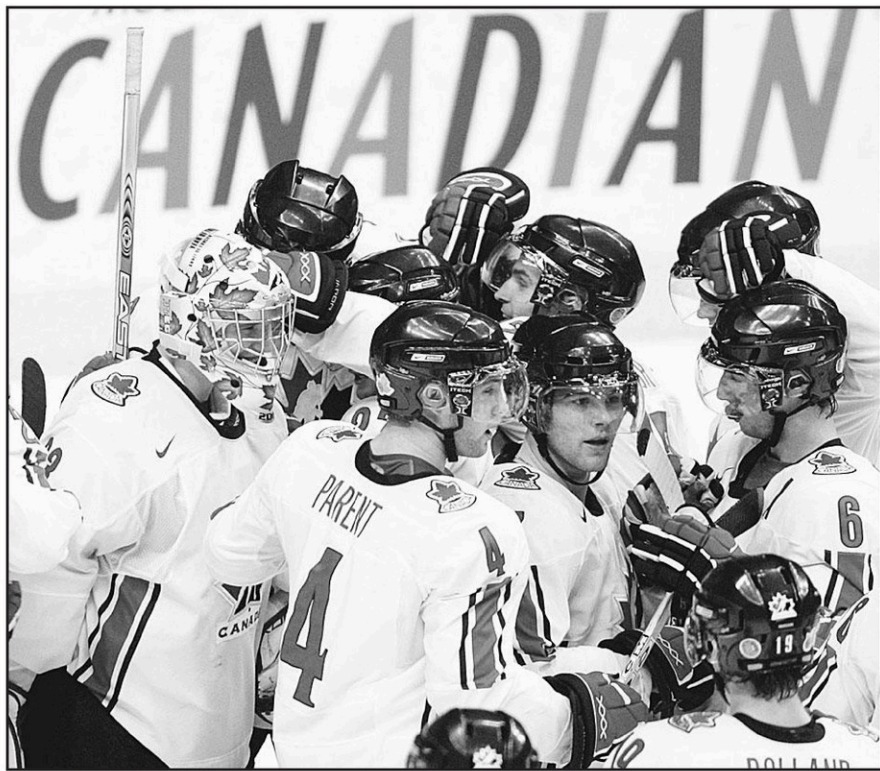
Le gardien canadien Justin Pogge, auteur du jeu blanc, a reçu les félicitations de ses coéquipiers au terme du match d'hier à Vancouver.