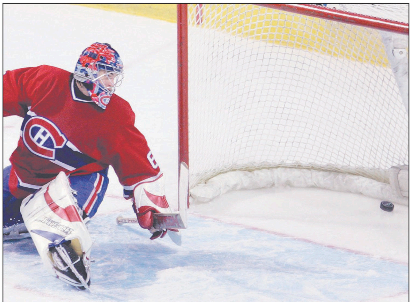
José Théodore a connu sa part d'ennuis, hier soir, face aux Penguins de Pittsburgh. Le gardien du Canadien a mal paru sur certains buts et la foule du Centre Bell n'a pas hésité à lui manifester son mécontentement.

Les Penguins ont eu l'avantage 36-33 dans la colonne des lancers, Marc-André Fleury étant supérieur à José Théodore.