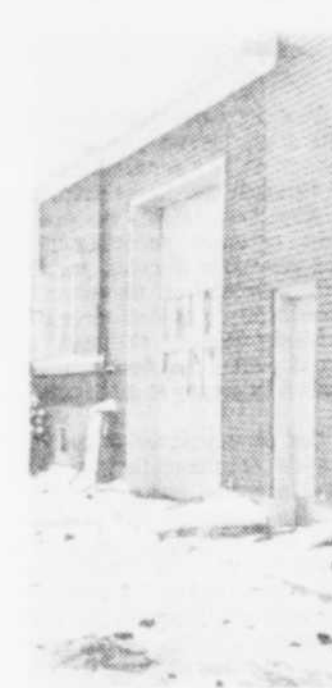
DES DEGATS CONSIDERABLES ont été causés à l'usine d'embouteillage Trottier, de Saint-Casimir, samedi après-midi.

avaient réservé les services de l'Agence Phillips de Trois-Rivières pour veiller à ce que les