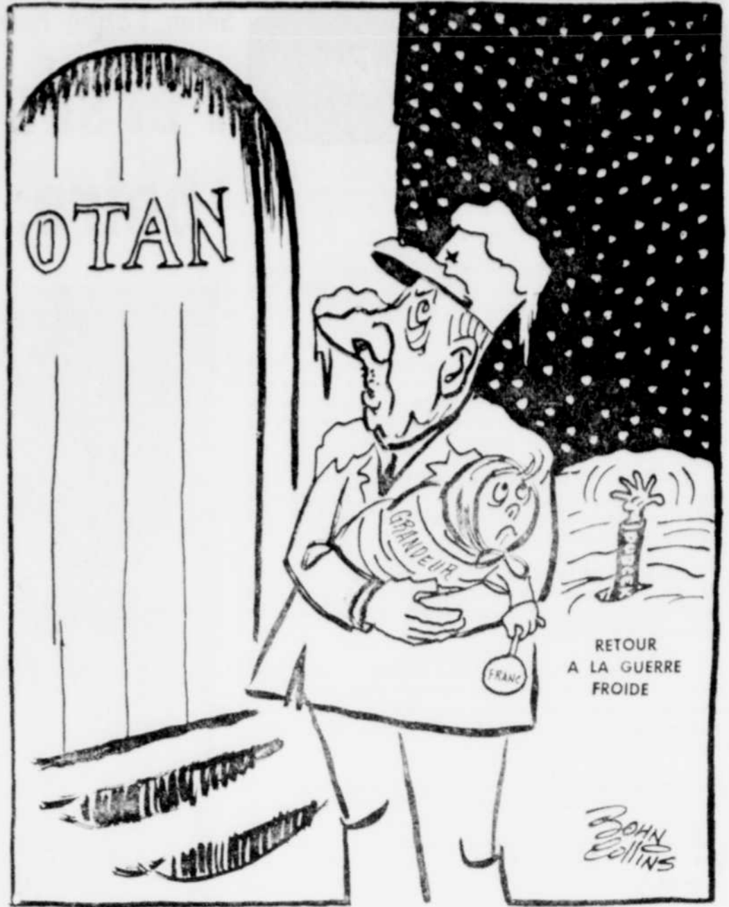
Bébé, c'est froid dehors