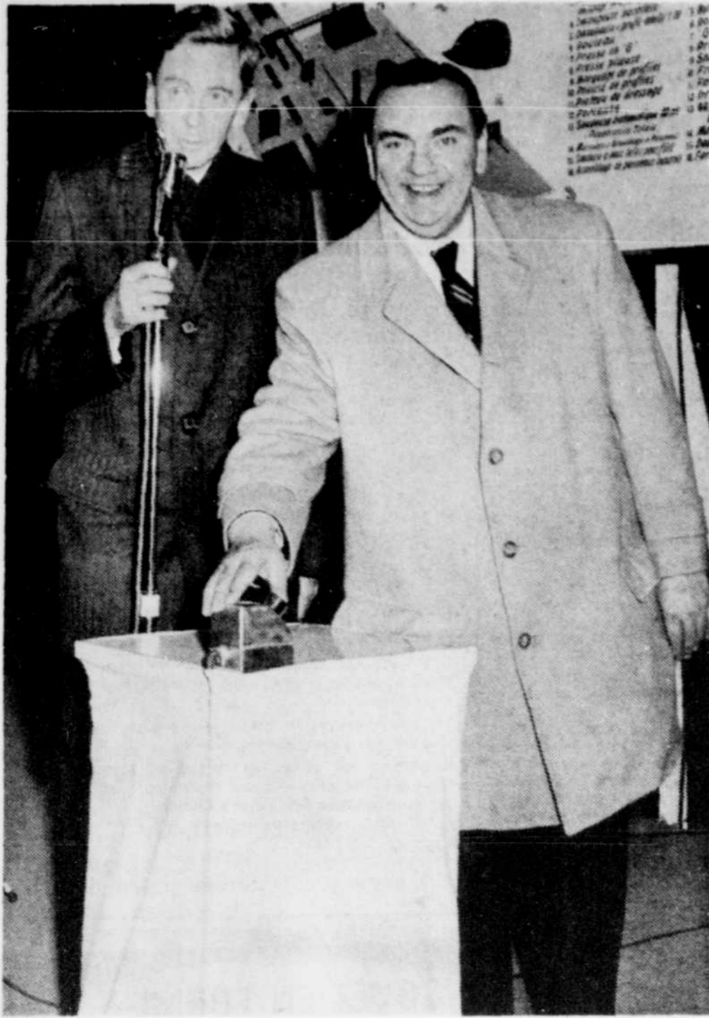
L'HON. D. C. JAMIESON, ministre de la Production de défense, pousse sur un bouton électronique, pour faire démarrer la soudeuse automatique de 40 pieds, une machine qui soude les plaques d'acier en une seule opération et