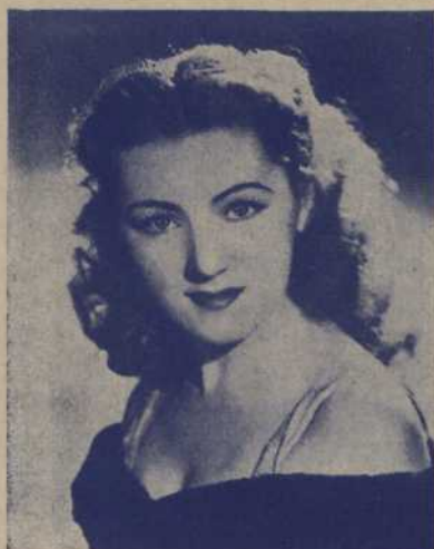
MIREILLE Pierrette Alarie