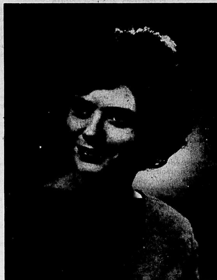
MISS "QUARTIER LATIN"