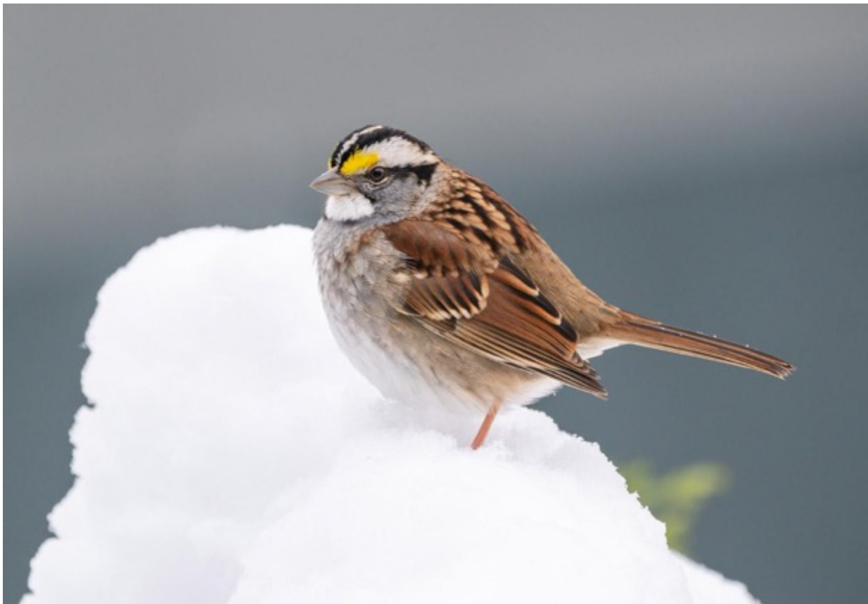
Bruant à gorge blanche

Les oiseaux ont également un système d'échange de chaleur à contre-courant dans leurs pattes et leurs pieds : les vaisseaux sanguins qui vont et viennent des pieds sont très proches les uns des autres, de sorte que le sang qui retourne au corps est réchauffé par le sang qui coule vers les pieds. Le sang fraîchement refroidi qui arrive aux pieds réduit la perte de chaleur, et le sang réchauffé qui retourne dans le corps empêche l'oiseau d'avoir froid. Et comme la circulation sanguine des oiseaux est très rapide, le sang ne reste pas assez longtemps dans les pieds pour geler.