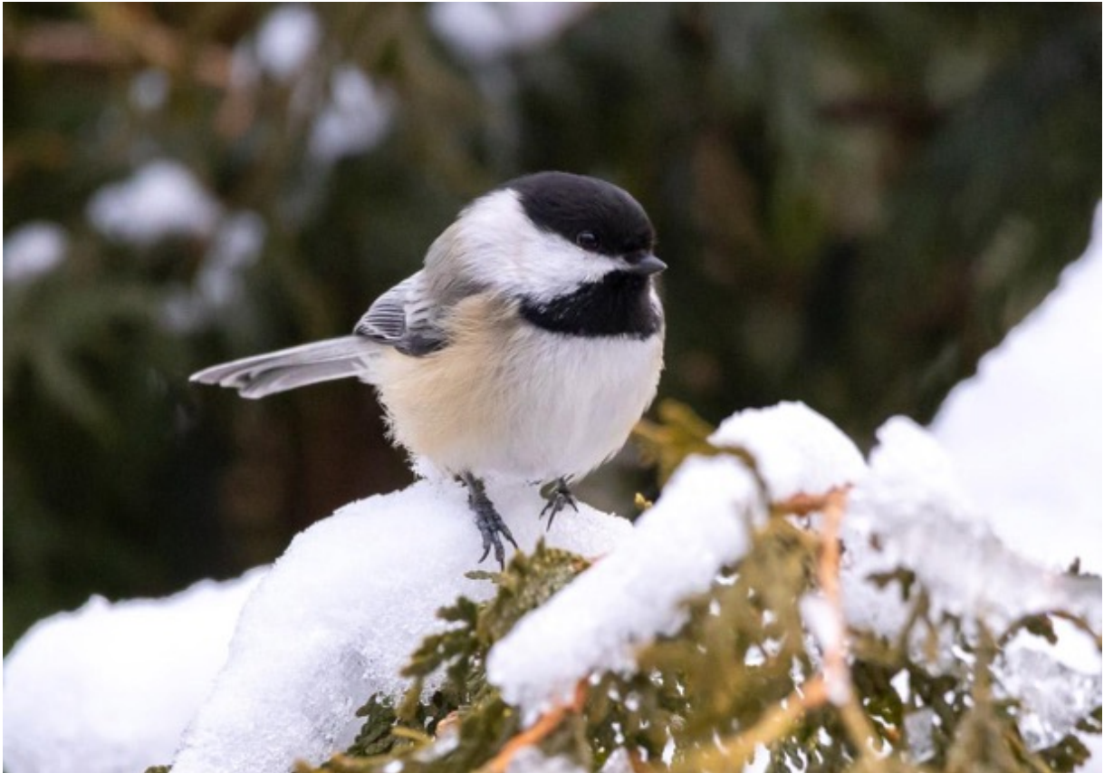
Mésange à tête noire