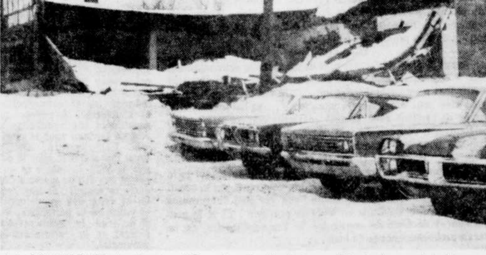
LA COUVERTURE de l'ancien "Canadian Tire", situé rue Principale ouest à Magog, s'est effondrée hier matin, causant de lourds dommages à la bâtisse. L'effondrement serait dû à l'accumulation de neige et de glace.

Activités — Au cours de l'année 1970, l'Association a décidé d'organiser un tournoi de pêche les 20 et 21 juin, à Weedon. Il y aura un tournoi d'organisé à East Angus, les 22 et 23 août 1970, et un tournoi de chasse aux marmottes le 31 mai. La prochaine assemblée de cette association sera tenue à la salle de l'école Labrecque, le 3 mars. Il y aura la projection de films et un prix de présence. Tous les sportifs y sont cordialement invités. L'assemblée sera d'une grande importance.