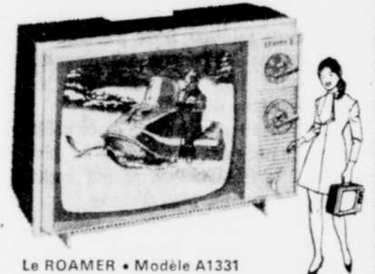
Le ROAMER • Modèle A1331