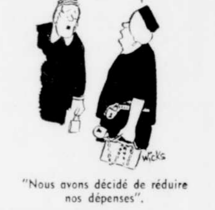
"Nous avons décidé de réduire nos dépenses".