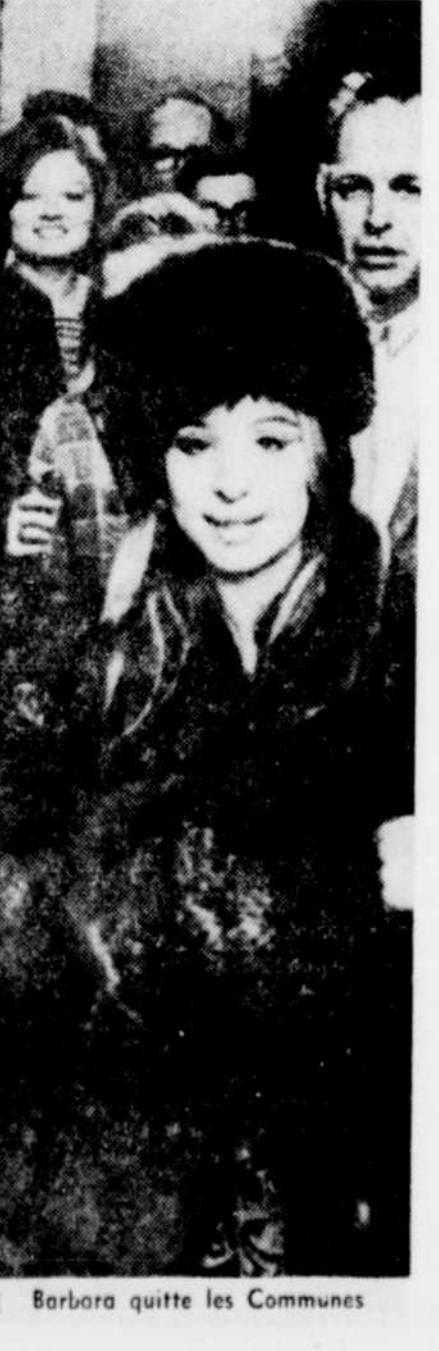
Barbara quitte les Communes

LONDRES (AFP) — Un bilan extrêmement positif de son voyage à Washington a été présenté hier matin par M. Harold Wilson à ses collaborateurs au cours d'une réunion du cabinet que le premier ministre a convoquée dès les premières heures de son retour à Londres. L'accueil exceptionnellement chaleureux que lui a réservé le président Nixon, les assurances qu'il a reçues dans le domaine économique, et l'encouragement que le chef de l'exécutif américain semble avoir donné à son projet de visite à Moscou, sont pour M. Wilson autant de motifs de satisfaction. Dans le climat pré-électoral qui prévaut maintenant en Grande-Bretagne, les entretiens Nixon-Wilson sont aussi, pour le parti travailliste, un atout précieux et une publicité presque insperée. C'est naturellement sur l'aspect économique de ces entretiens que s'est surtout concentrée l'attention des milieux politiques londoniens. Le premier ministre a quitté les Etats-Unis persuadé que les dangers d'une récession américaine, qui menacerait l'économie britannique, sont très exagérés.