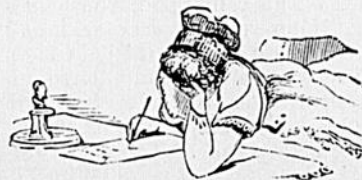
Jardin Viger, 18 août.