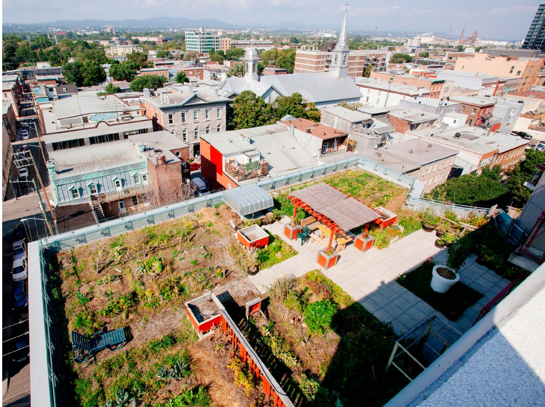
Le toit de l'immeuble Pech-Sherpa, Québec (programme Supplément au loyer)