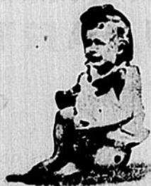
Il boit des eaux falsifiées

Téléphone Bell No. 2. Boîte de Poste No. 19.