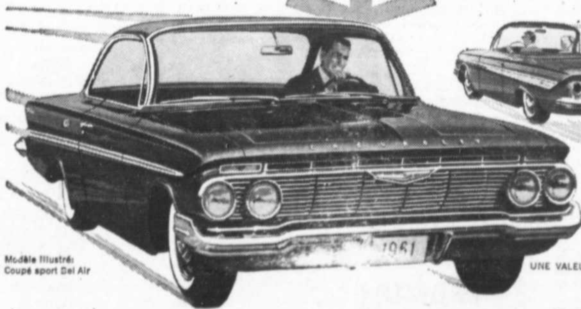
Modèle illustré: Coupé sport Del Air