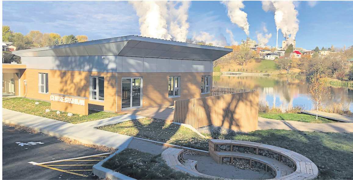
Le Centre Sakihikan est situé au lac Saint-Louis.

La Ville ne veut pas en rester là. Il y a une volonté de réaménager le reste du lac. On veut poursuivre la suite logique des travaux.