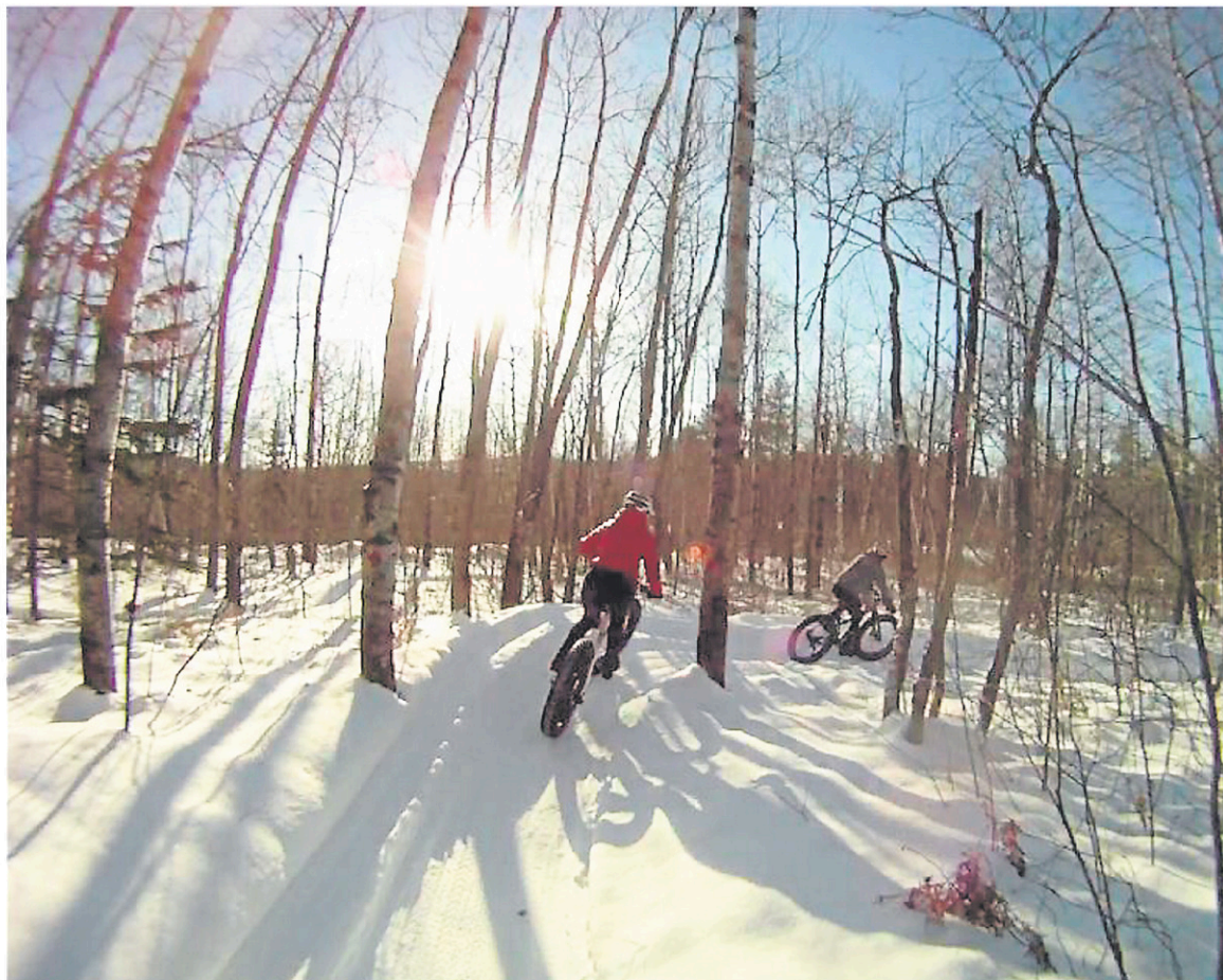
Les amateurs de vélo de montagne sont bien servis en Haute-Mauricie avec Mauricycle, encore plus depuis l'ajout de pistes de fatbike.

Les adeptes sont aussi nombreux. Une soixantaine de membres parcourent les pistes de façon régulière durant la saison froide. «C'est énorme pour une place comme La Tuque. Il y a des gens de 12 ans à 70 ans. Les sentiers sont pensés en conséquence. [...] On reçoit également