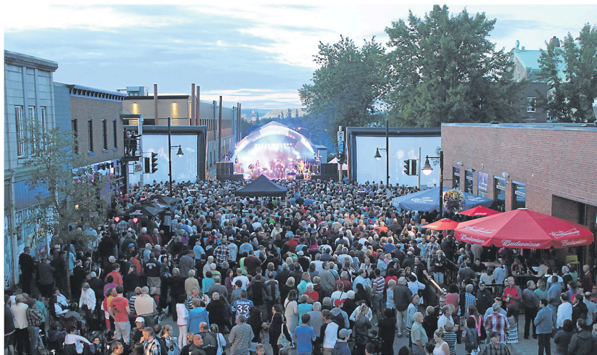
Les Jeudis centre-ville sont toujours aussi populaires à La Tuque.