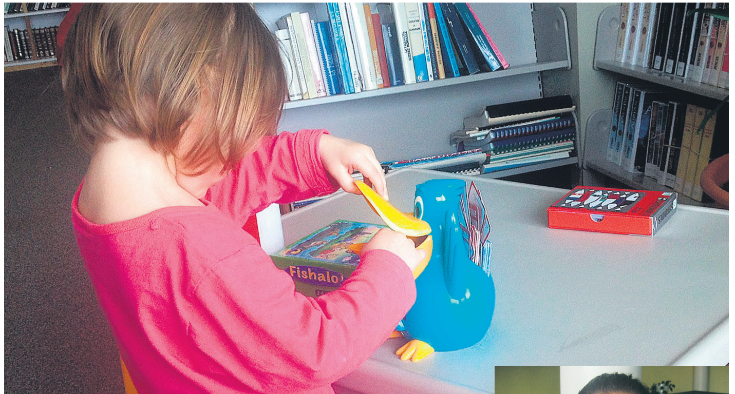
Un enfant jouant à la joujouthèque - J'ai la permission des parents!

D'abord conçue pour des enfants de 0 à 5 ans, la joujouthèque est heureuse de pouvoir maintenant accueillir des jeunes de 0 à 12 ans et d'offrir des jeux adaptés à chaque groupe d'âge. Le bassin d'enfants pouvant bénéficier du service de la joujouthèque est ainsi augmenté.