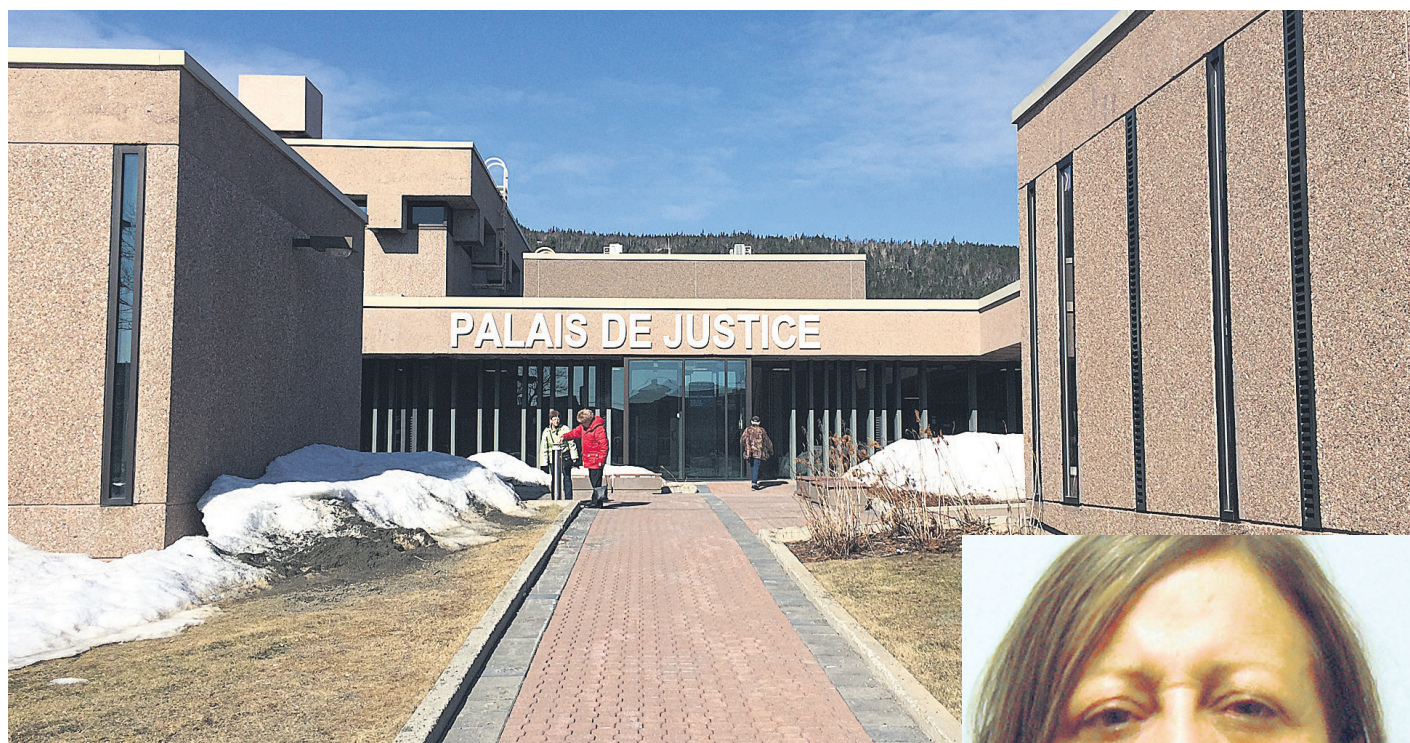
Plusieurs dizaines de personnes étaient au rendez-vous pour écouter le jugement au Palais de justice de Percé.

Quatorze ans plus tard, en mars 2012, le dossier est revu par un enquêteur des « cold case » de la Sûreté du Québec. En septembre de la même année, une enquête de type Mister Big est autorisée concernant ce meurtre. Le Projet Esturgeon est donc mené entre le 21 novembre 2012 et le 19 juin 2013. Le 19 juin 2013, Johanne Johnson avoue au grand patron (Mister Big) avoir tué James Dubé d'une balle dans la tête