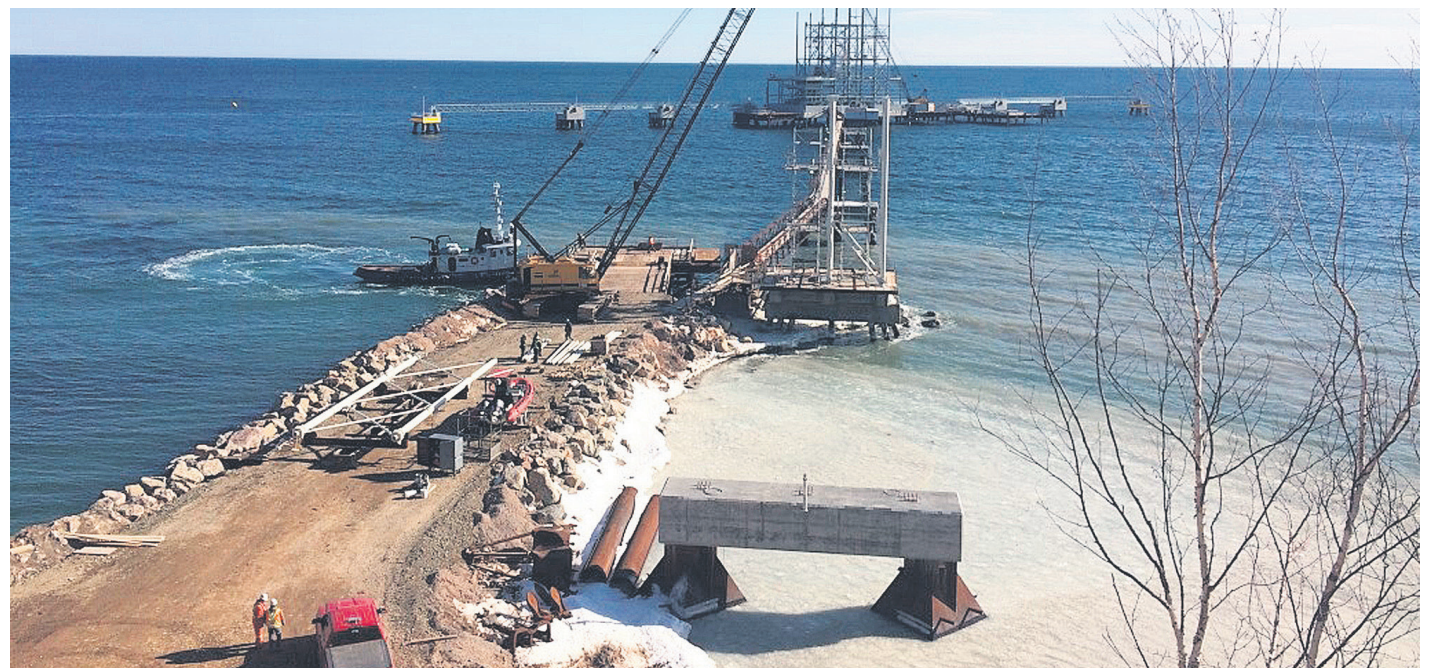
Après quelques mois de pause au chantier maritime, les activités ont repris récemment avec le montage des tours de chargement du ciment et de réception des matières premières.