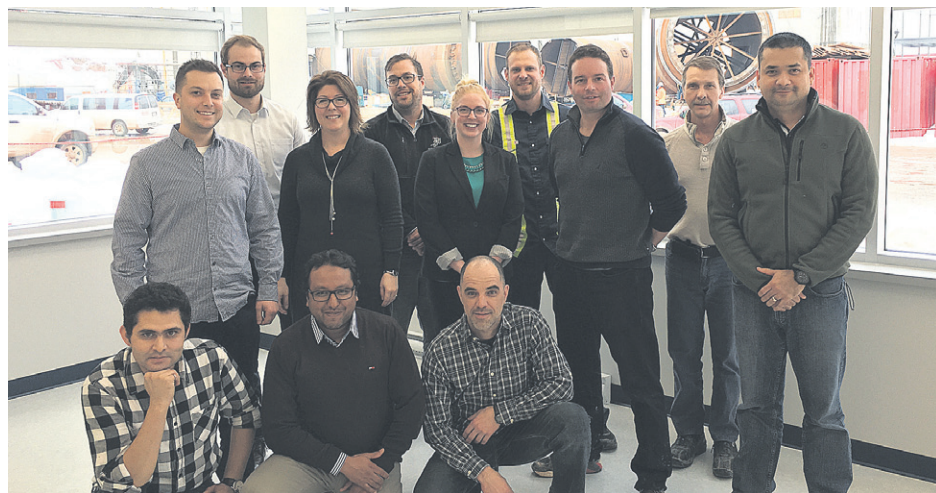
Une partie de l'équipe exploitation de Ciment McInnis, dans la salle de contrôle, devant la ligne de cuisson.

TRAVAUX. Des progrès importants dans la construction de nombreux éléments formant le complexe industriel à Port-Daniel-Gascons sont