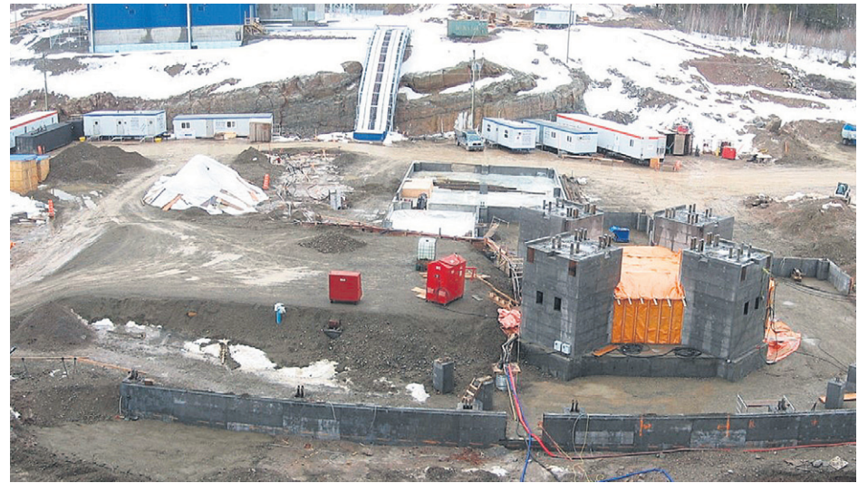
Ciment McInnis a reçu une grande partie des équipements et les travaux se poursuivent toujours selon l'échéancier prévu, soit en visant le démarrage des opérations commerciales au début de 2017.

Les membres du comité réitèrent qu'à compétences égales, l'emploi local est une priorité. Ils continueront d'être à l'écoute de la population et de s'assurer que Ciment McInnis fait tout l'effort nécessaire pour optimiser l'embauche de travailleurs de la région en commençant par ceux de Port-Daniel-Gascons. (A.L.)