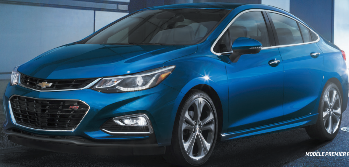
MODÈLE PREMIER RS ILLUSTRÉ