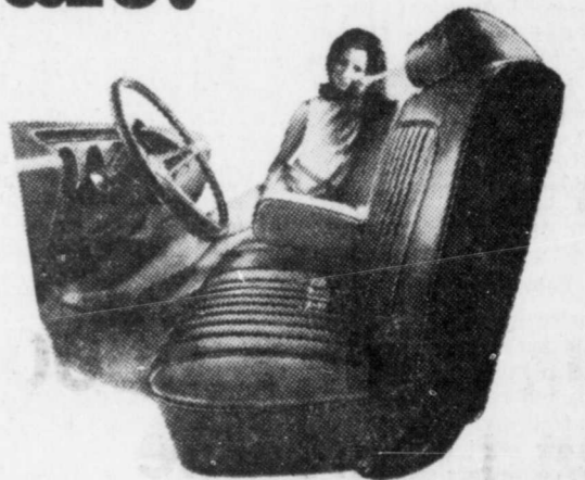
Le siège avant standard, à dossiers individuels, de la Luxury Le Mans.

Tout ce luxe vous est offert dans un hardtop de juste prix, en versions deux portes ou quatre portes. Le modèle deux portes peut être équipé d'un siège avant à dossiers individuels ou de sièges-baquets standard. Dans les deux modèles, les sièges avant et arrière sont rembourrés de mousse, l'insonorisation y est améliorée, le moteur est un V8. Voyez la nouvelle Luxury Le Mans, elle vous offre bien plus encore.