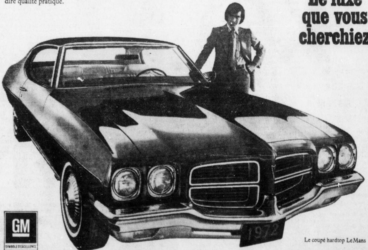
Le coupé hardtop Le Mans

Certains des équipements représentés ou cités ici sont fournis en option, moyennant supplément.