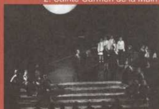
2. Sainte Carmen de la Main