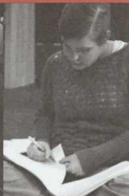
Prises de notes