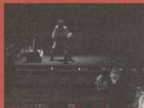
4. Le Capitaine Fracasse