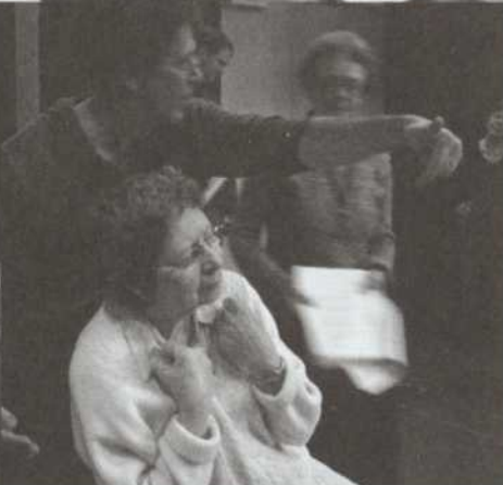
Mise en place