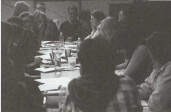
Réunion de production