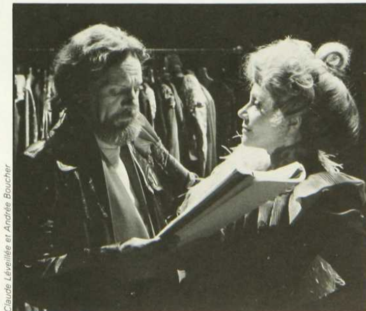
Claude Léveillée et Andrée Boucher