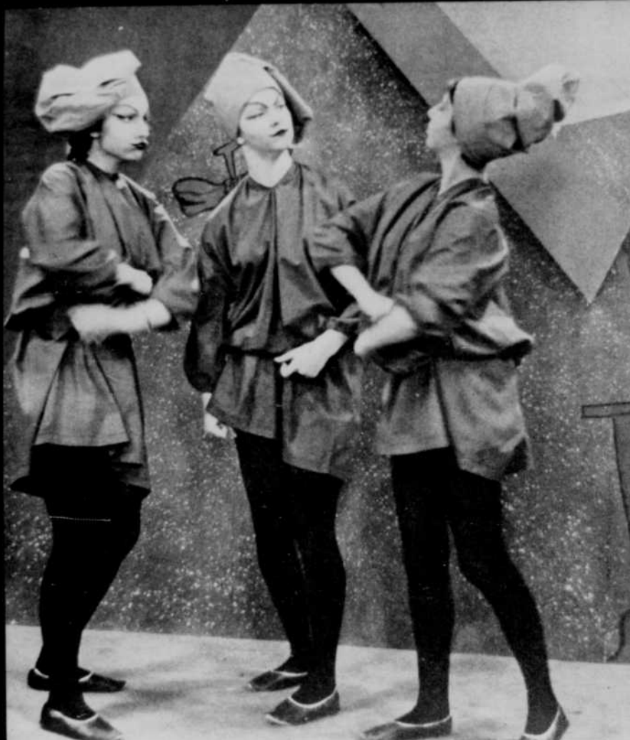
Trois étudiantes du Collège Sacré-Coeur de Sherbrooke ont joué avec brio "la Farce de la cornette" de Chanceler.