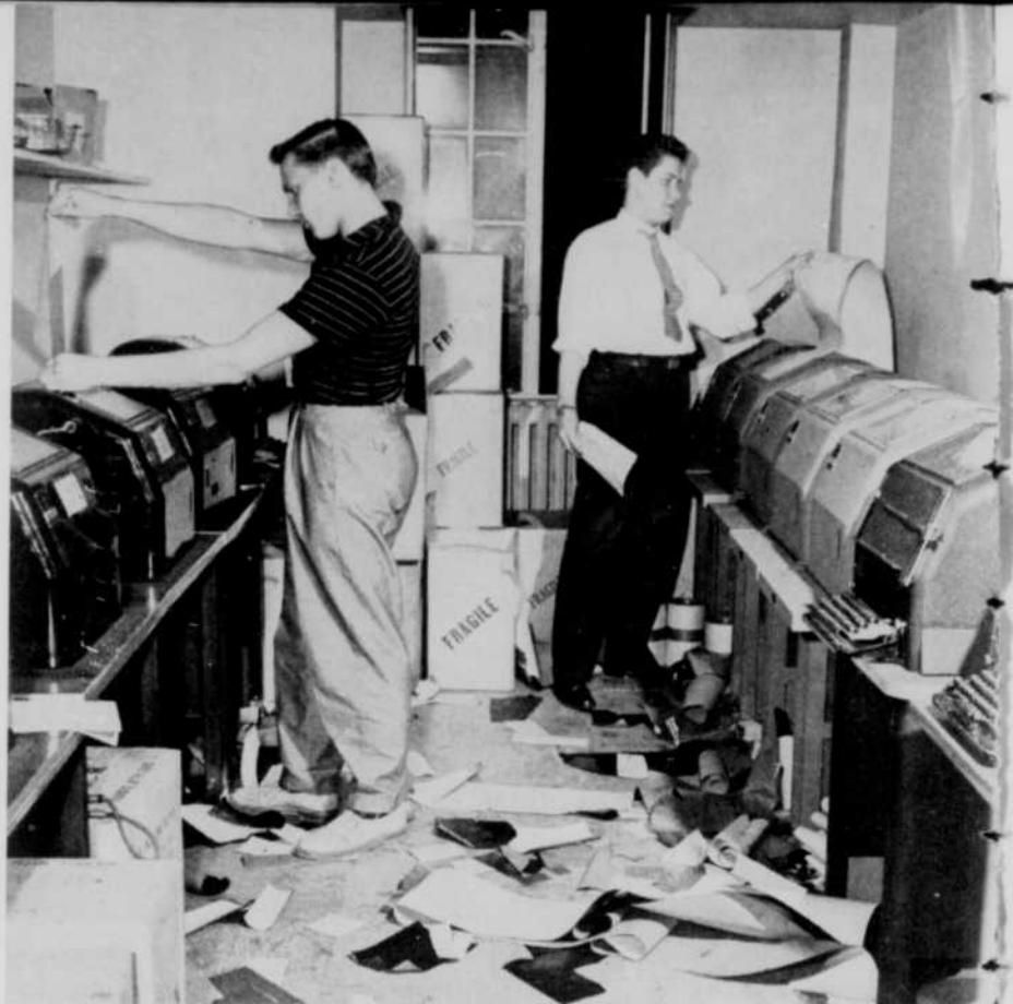
Les soirs d'élections, on ne ramasse pas les papiers dans la salle des dépêches de Radio-Canada... faute de temps!

Nous aurons ensuite l'occasion de voir en direct les correspondants spéciaux de la télévision de Rouyn-Noranda, Ottawa, Sherbrooke, Trois-Rivières, Québec et Rimouski. À Montréal, quatre caméras serviront au studio 42, devenu le chef-lieu de l'information, et trois autres au studio 40.