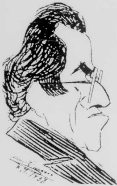
Mahler (dessin de Caruso)

A LORS qu'en Europe, la saison des festivals vient à peine de commencer, au réseau français de Radio-Canada, Festivals européens s'achèvera en beauté les deux dernières semaines de juin.