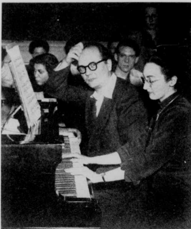
Olivier Messiaen avec Yvonne Loriod