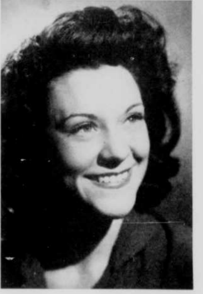
MARIA CASARÈS, comédienne que le public canadien connaît par le cinéma et par quelques apparitions sur une scène montréalaise, parlera d'elle-même et de sa carrière à l'émission Figures de théâtre, le jeudi 23 juin à 11 h. 30, au réseau français de TV.