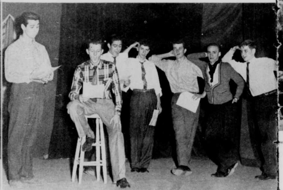
Excellent numéro... "la Revue des Para-sco" présentée par un groupe d'élèves du Collège Ste-Marie de Montréal.