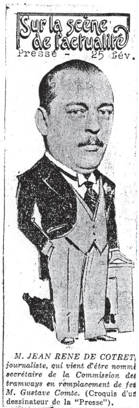
Figure 2 : Caricature parue dans La Presse , à l'occasion de la nomination de Jean René de Cotret à la Commission des tramways de Montréal.