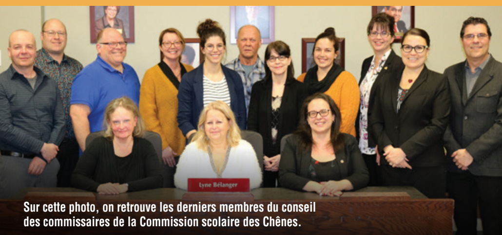
Sur cette photo, on retrouve les derniers membres du conseil des commissaires de la Commission scolaire des Chênes.

À ces femmes et ces hommes qui nous ont accompagnés : MERCI... et Au revoir !