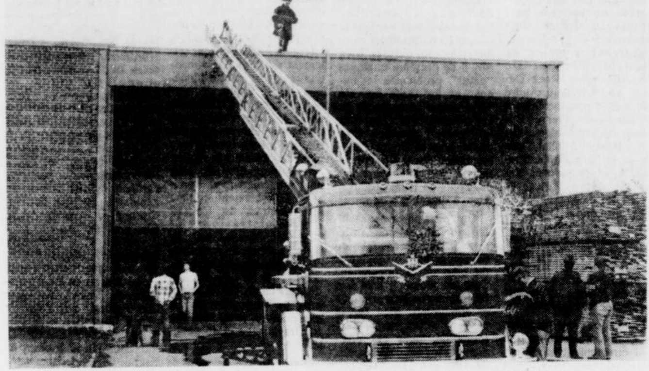
L'alerte au feu n'était pas une lart de pratique à l'école du meuble et du bois ouvré de Victoriaville hier. Un début d'incendie a en effet dû y être maîtrisé par une douzaine de sapeurs de Victoriaville. Le foyer localisé dans un incinérateur a répandu une fumée très incommode dans toute l'école.

VICTORIAVILLE (SB) — Les étudiants de l'école du meuble et du bois ouvré qui venaient d'être évacués à la suite du déclenchement de l'alarme à feu croyaient qu'il s'agissait de l'une des pratiques exigées par le service de protection des incendies dans le cadre de la semaine de prévention. Mais il n'en était rien. La fumée envahissait presque le second étage de la