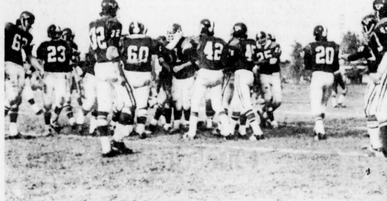
La joie des Vulkins était à son comble, lorsque ils ont pris le dessus pour remporter une victoire de 22 à 14 sur les Inouks de Granby. Cette partie inaugurerait la saison des Vulkins et les instructeurs autant que les joueurs entendent satisfaire leurs partisans qui s'étaient massés sur les nouveaux gradins pour la première partie.

LA TRIBUNE VUE et LUE PAR PLUS DE 200,000 PERSONNES TOUS LES JOURS