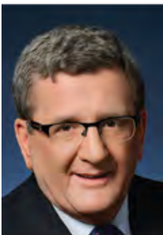
Maire Régis Labeaume

L'Alliance Arc-en-ciel est fière d'annoncer que l'édition 2014 de la Fête Arc-en-ciel de Québec présentée par TD se déroulera sous le signe du renouveau durant la fin de semaine de la fête du Travail, du jeudi 28 au dimanche 31 août. Une exposition d'art public, un brunch familial pour l'égalité et une grande marche de la diversité s'ajoutent à la programmation sous le thème « Les visages de la fierté ».