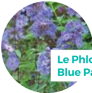
Le Phlox Blue Paradise