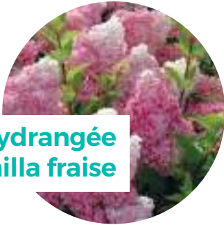
L'hydrangée Vanilla fraise