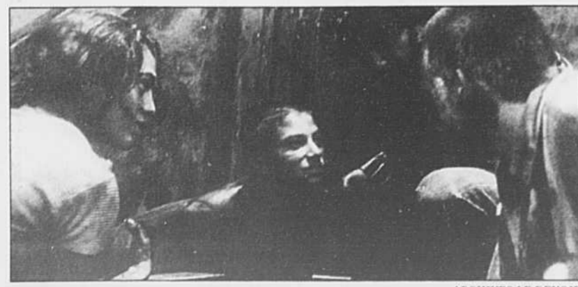
Une scène du film Les Clandestins