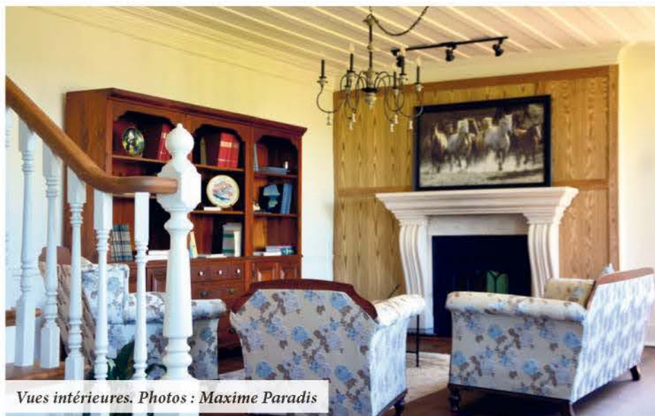
Vues intérieures.

La pierre, omniprésente à l'extérieur, se démarque aussi au premier niveau. Ensuite, elle se décline principalement sur les manteaux de cheminée des étages supérieurs. Au nombre de trois, deux de ces cheminées ont retrouvé leur pleine fonctionnalité. La troisième trône