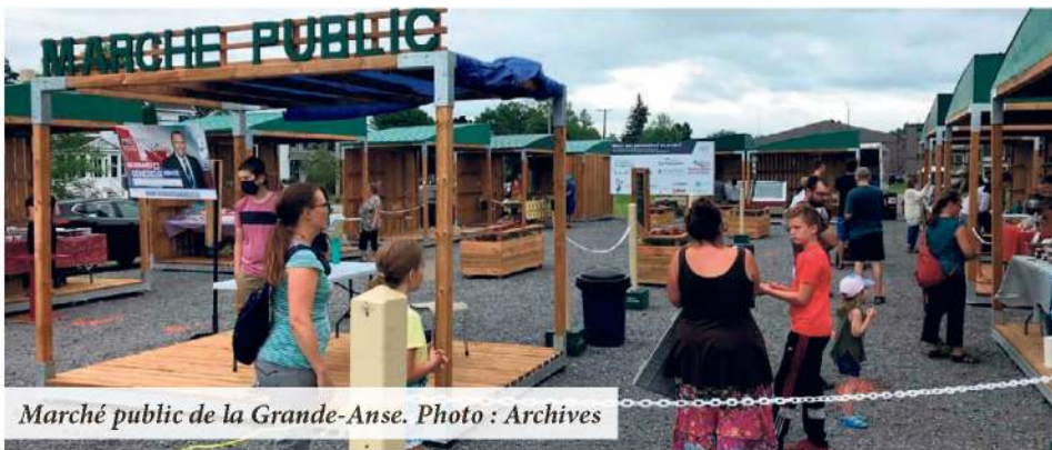
Marché public de la Grande-Anse.

La saison estivale des marchés publics débute officiellement dans le Bas-Saint-Laurent. L'effervescence des marchés publics se fait sentir à la grandeur de la province pendant l'été et rend les assiettes des Québécois plus locales que jamais.