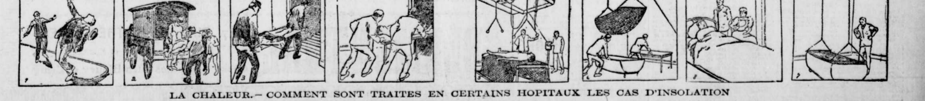
LA CHALEUR. — COMMENT SONT TRAITÉS EN CERTAINS HOPITAUX LES CAS D'INSOLATION