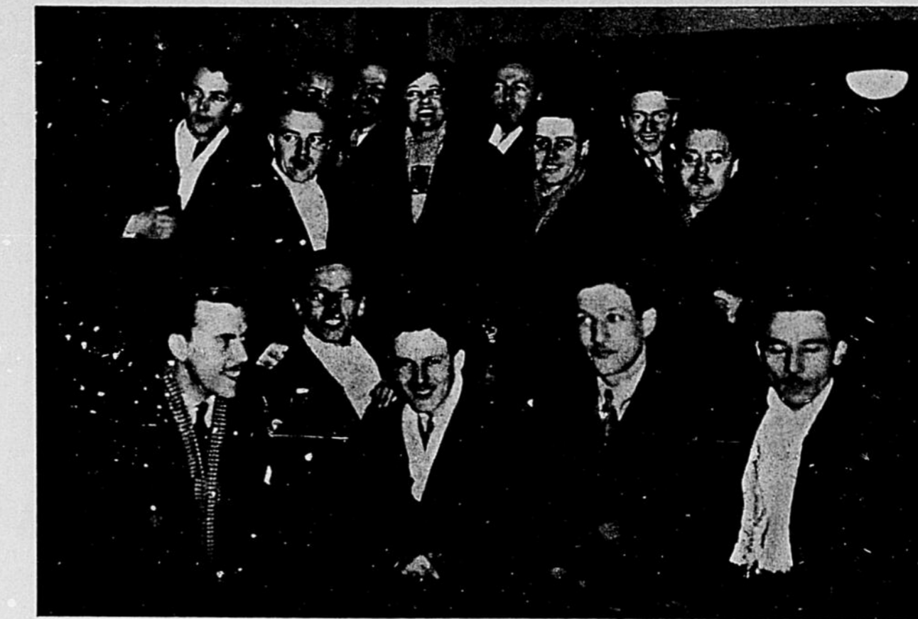
Lucienne Boyer, la charmante artiste française, pose spécialement pour le "Quartier Latin," entourée d'une phalange d'étudiants.

Que faire alors ? On se dirige tant bien que mal vers la porte de sortie de la gare. Lu-