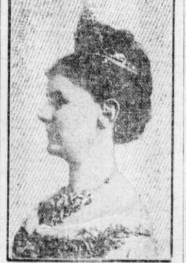
La reine Wilhelmina, de Hollande, qui a donné le jour à une fille, ce matin.