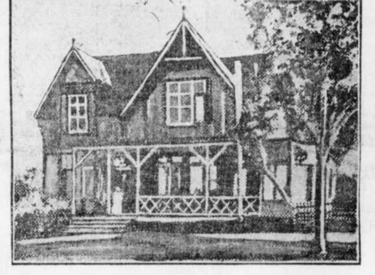
Le "Metropolitan Golf Club", ferme Fletcher, détruit par un incendie hier soir.

Le chef Tremblay eut vite fait de prendre ses dispositions. L'équipe de protection de la caserne No 2, arrivée la première, étendit ses toiles couchées sur les marchandises exposées au rez-de-chaussée; trois lances furent montées au deuxième étage du côté de la rue Saint-Jacques, on en mit le double du côté de la rue Notre-Dame et sur le toit où le feu était monté par la cage des escaliers et de l'ascenseur et en très peu de temps le feu fut assez maîtrisé. A suivre sur la page 5