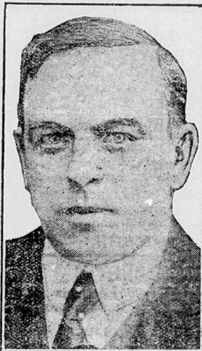
L'Honorable L.-W. Mackenzie King, premier ministre du Canada.