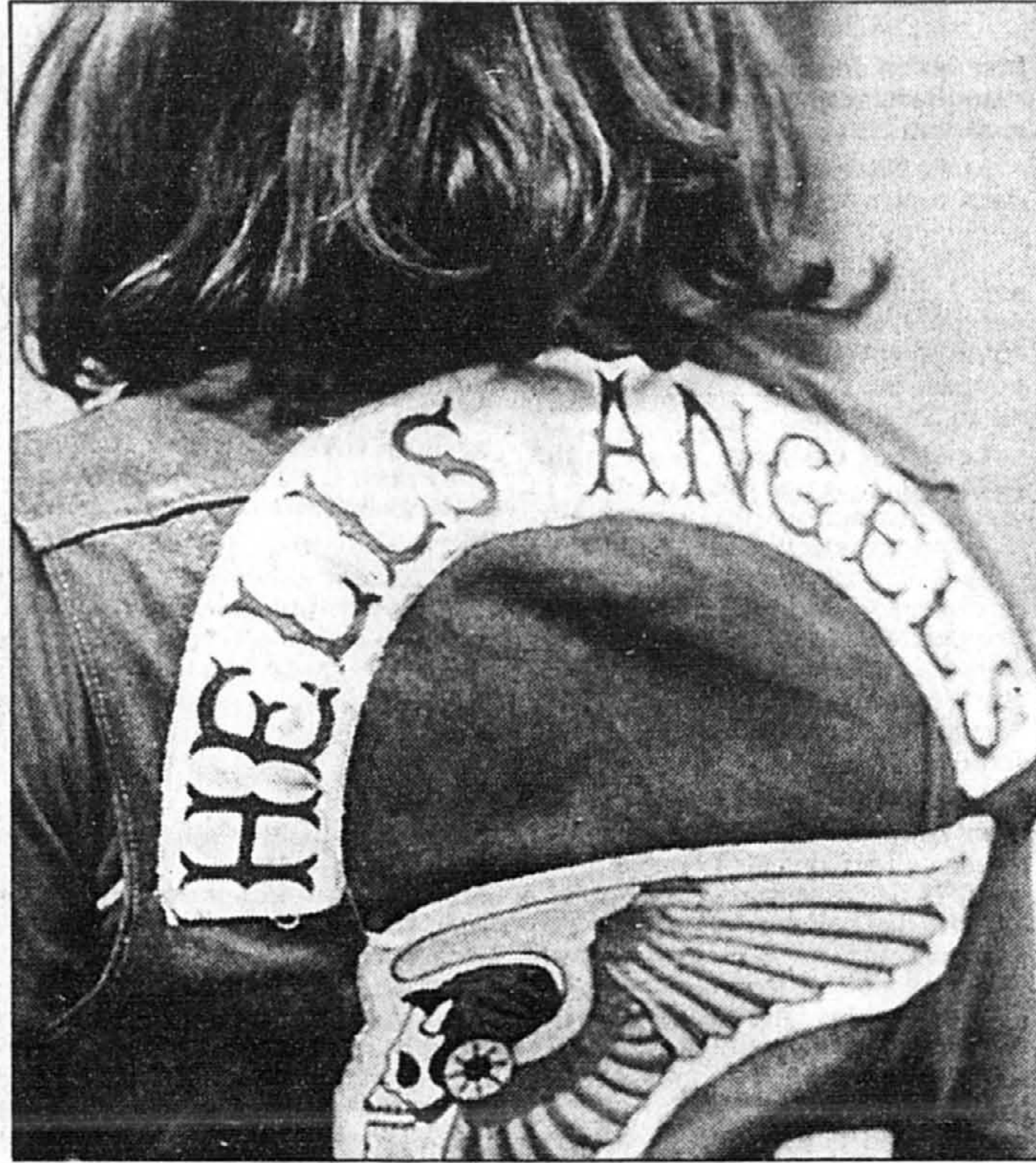
Les Hells Angels constituent le groupe le plus puissant et le mieux structuré du crime organisé.

Vingt ans plus tard, que nous manque-t-il pour lutter efficacement contre le crime organisé? Je