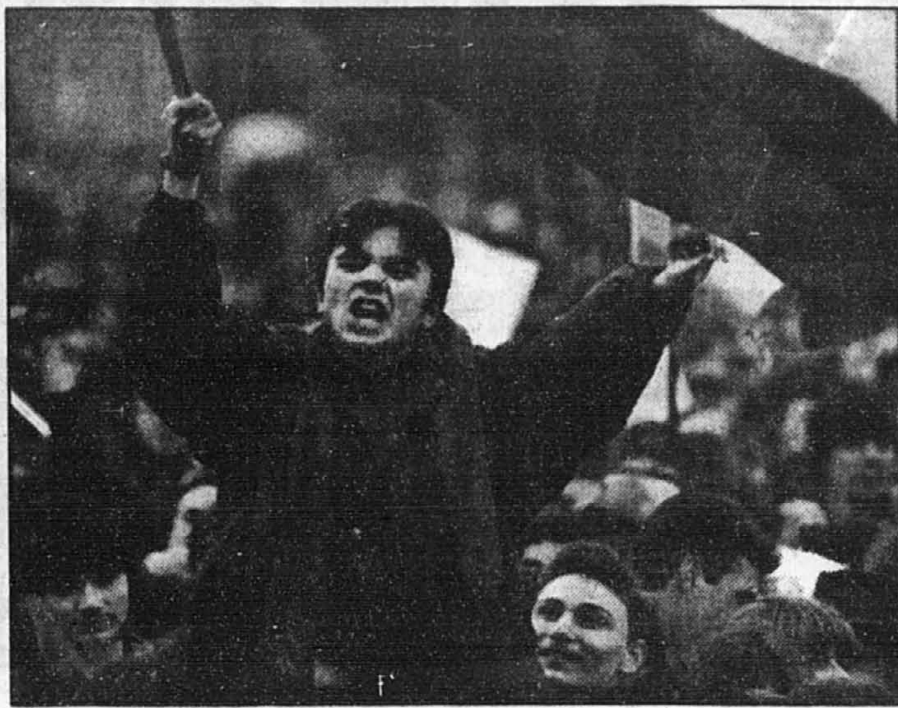
Un jeune homme brandit le drapeau national de la Bulgarie lors d'une manifestation monstre tenue à proximité du parlement, à Sofia, pour réclamer du gouvernement élu la tenue d'élections anticipées.