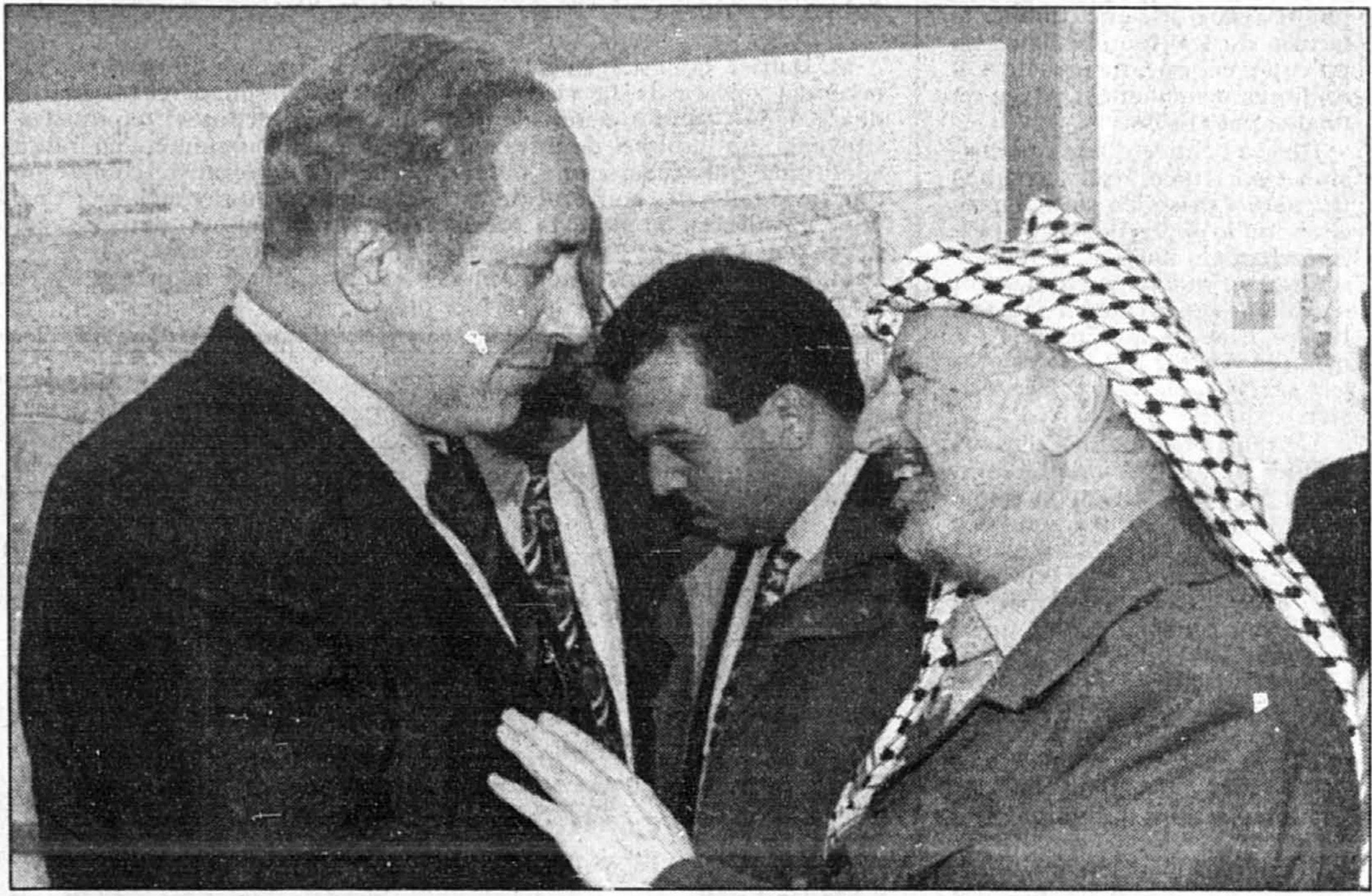
Le premier ministre israélien Benjamin Netanyahu et le président de l'Autorité palestinienne Yasser Arafat, lors de la signature de l'accord sur Hébron hier soir.

Les représentants des quelque 400 colons juifs de Hébron se sont déclarés « profondément déçus » par l'accord. « Netanyahu est tombé dans le piège tendu par Yasser Arafat », a affirmé Noam Arnon, un