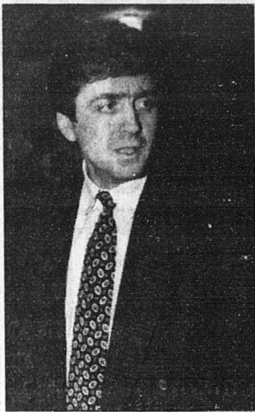
Le chef du Parti socialiste, au pouvoir en Bulgarie, Georgy Parvanov : va pour les élections anticipées.