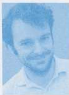
FRANCIS MONTY AUTEUR

Les portraits, ça me plaît. Ici, ce qui est important, ce n'est pas de bien ficeler le récit, mais de savoir saisir le moment. Comment montrer le sujet, comment le surprendre pour qu'il se dévoile, un peu. Pour que même figé, même arrêté dans le temps, il continue à vivre. Clic! Bon, il sourit. Il veut visiblement nous montrer ses dents. Mais qu'est-ce qu'il y a derrière ce sourire? Sourit-il vraiment? Et tout à coup, on le regarde autrement, ça y est, un autre monde s'ouvre à nous... On essaie de s'imaginer ce qu'il y a au-delà de l'image : par ce sourire en coin, on devine sa timidité. Ce n'est sûrement pas facile pour lui, par exemple, de prendre l'autobus. Mais dans l'autobus, il y a des rencontres possibles... oui, mais comment faire? Il est si maladroit, ça se voit à ses mains qui ne savent pas tenir son sac, vous aussi vous avez les mêmes mains, vous savez ce que c'est.