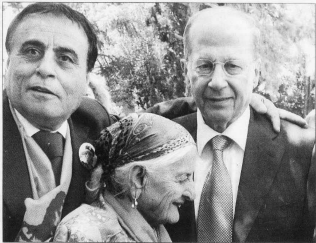
Michel Aoun a rencontré des partisans hier à sa résidence de Beyrouth.