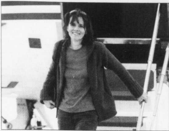
Florence Aubenas à son arrivée à Paris dimanche.