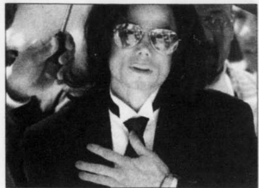
Le chanteur Michael Jackson quittant le palais de justice après son acquittement, hier