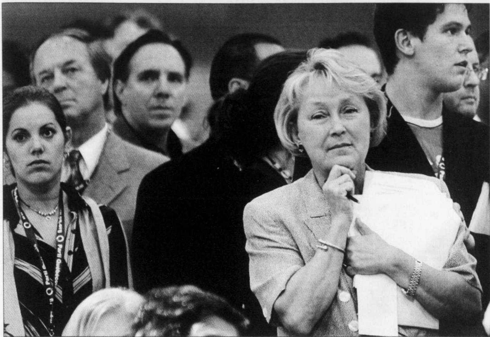
Pauline Marois, que l'on voit ici lors du dernier congrès national du Parti québécois, rappelait récemment à quel point elle entendait concilier les velléités pourtant irréductibles des membres de son parti, et ce, pour créer l'apparence d'un consensus au PQ et élargir sa base électorale. Mais est-ce vraiment la bonne solution?