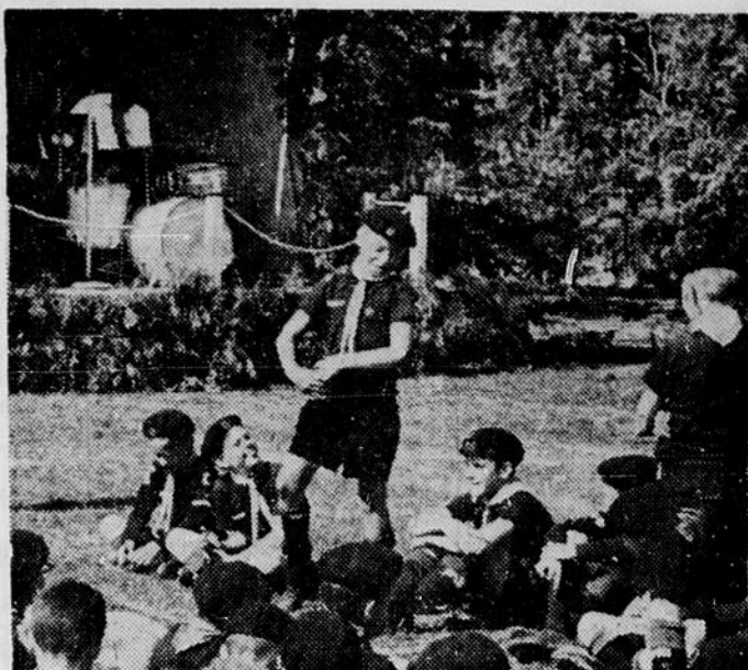
Au clair soleil est une émission hebdomadaire estivale du réseau français de Radio-Canada faite par des jeunes pour les jeunes, dans des colonies de vacances du Québec. L'émission, diffusée tous les mardis après-midi à 5 h. 30, se compose de danses, de jeux et de chants et donne aux enfants l'occasion de s'exprimer avec toute leur spontanéité naturelle devant les caméras de télévision.