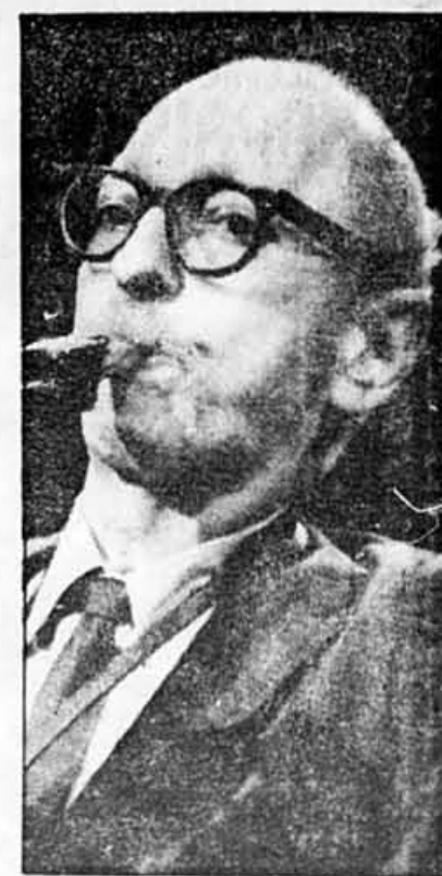
Park « Pepper » Adams

Né dans une petite ville du Michigan, il avait grandi à Detroit. Il s'était mis au saxo baryton à l'âge de 12 ans, avait-il raconté, à cause de son admiration pour Harry Carney qui faisait