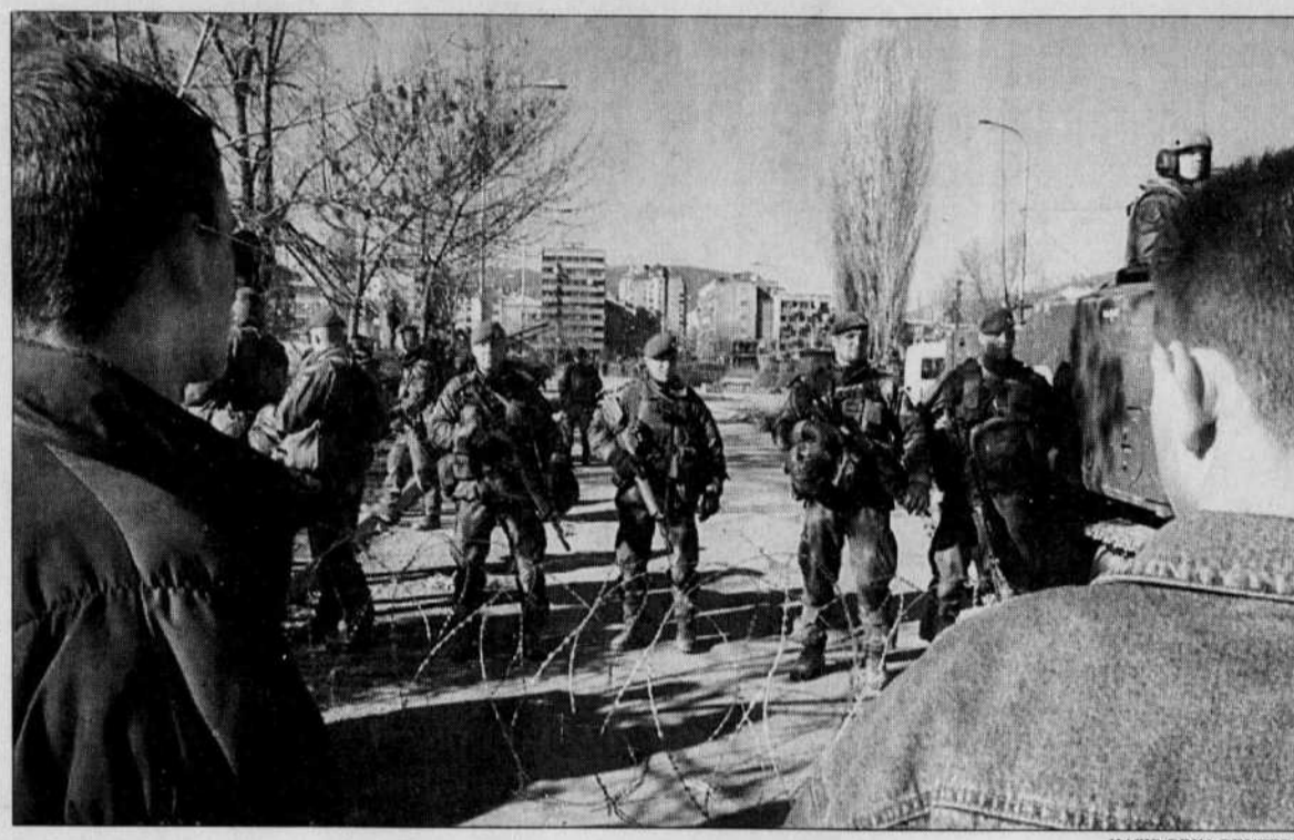
Des soldats suédois de la KFOR empêchent des Albanais de franchir le pont qui relie les deux parties de Mitrovica.

L'agence yougoslave Tanjug a accusé les «terroristes albanais». Des responsables locaux serbes affirment avoir identifié deux agresseurs albanais. Mais selon la cinquantaine d'Albanais qui ont gagné la partie sud, des Serbes auraient lancé des grenades sur leurs maisons, allant de