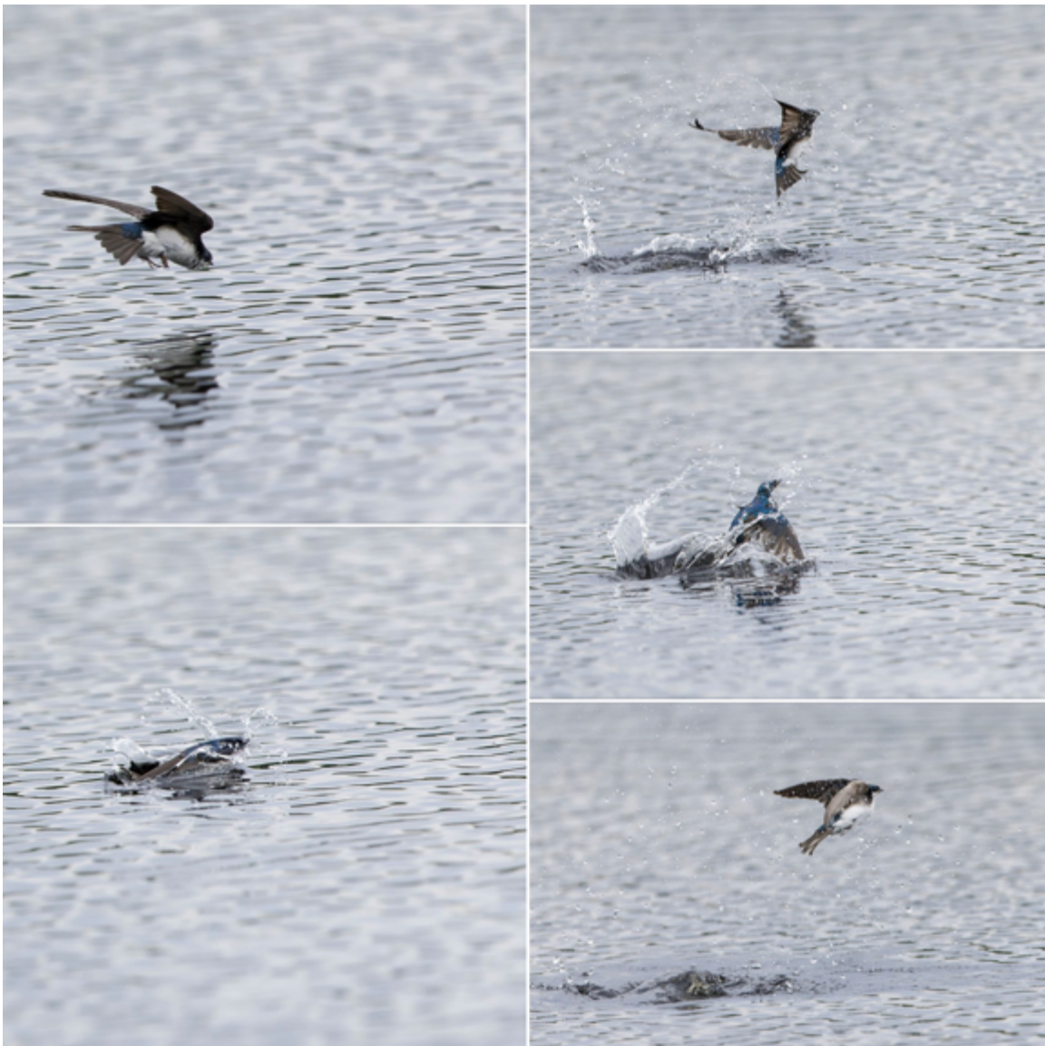
prises le 2022-06-15 à 02.01.17