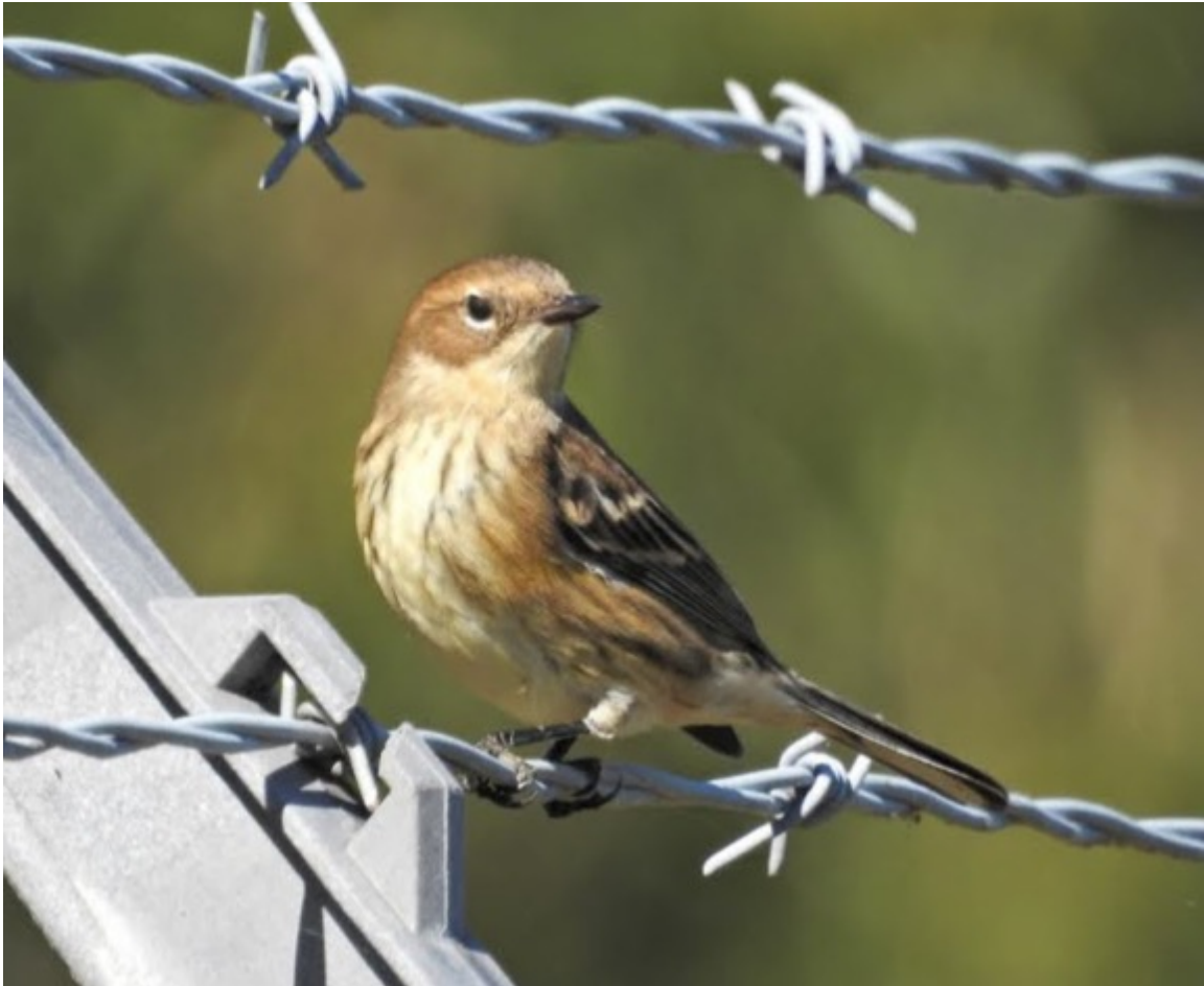
Paruline à croupion jaune