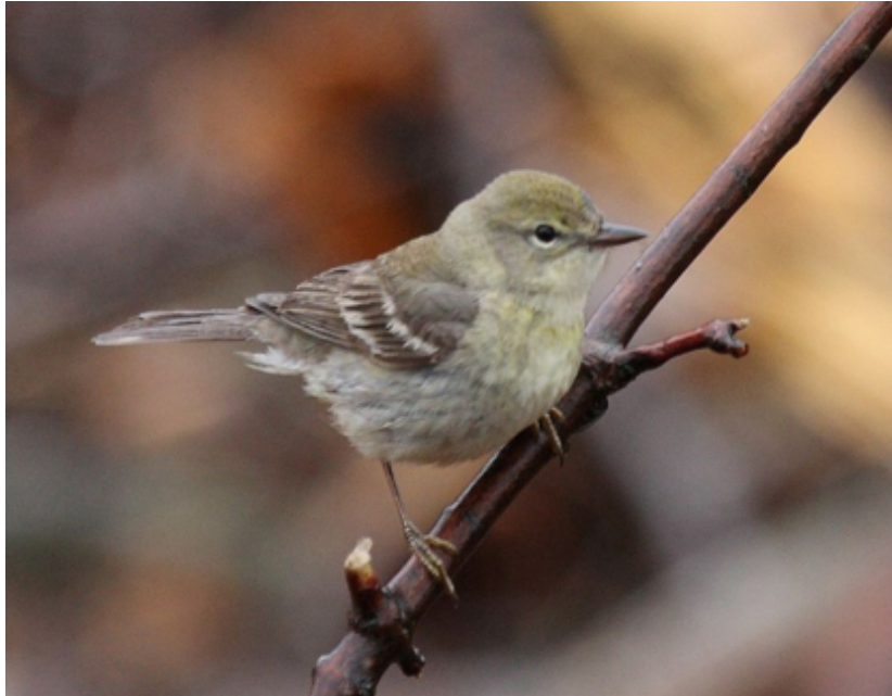
Paruline des pins.

La queue est également plus longue. Le plumage du mâle adulte est nettement plus jaune, surtout à la gorge et la poitrine. Les rayures sont larges et relativement peu contrastées . Les sous-caudales sont bien blanches, et les pattes et pieds sont sombres. Le plumage de la femelle de l'année est très gris, sans jaune. Cependant, le dos uni reste le critère distinctif entre ces 3 espèces déroutantes.