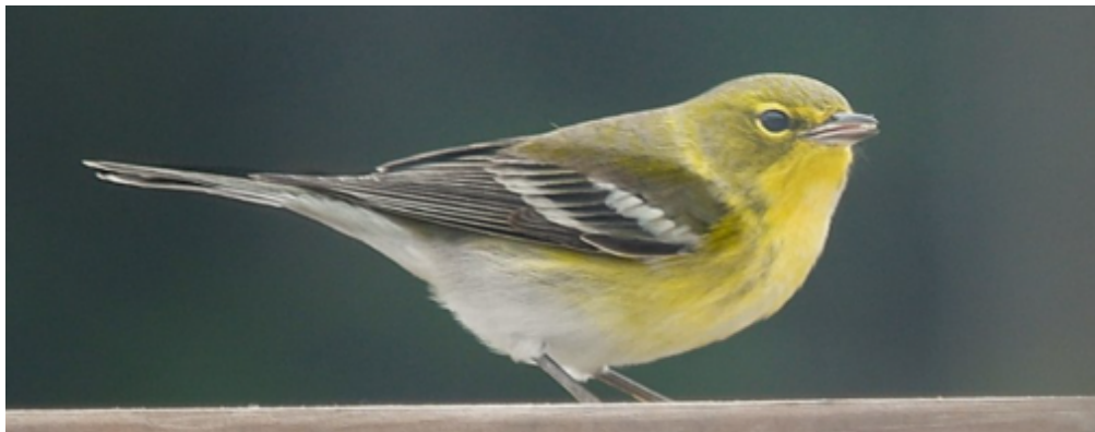
Paruline des pins.

La Paruline rayée est très semblable au plumage d'automne de la Paruline à poitrine baie, mais avec quelques différences. Elle n'a pas la teinte ocre caractéristique de la paruline précédente, elle est plutôt jaune pâle sur la gorge et la poitrine , le bas du ventre et les sous caudales sont blanches. La queue est courte. Elle n'a pas la tache sombre au haut de la cuisse, et surtout, elle est plus rayée . Ces rayures sont minces et relativement foncées , discrètes et bien visibles à la fois. Le dos est également plus rayé . L'aspect est nettement plus rayé et contrasté que la P. à poitrine baie. Finalement, probablement le critère distinctif le plus important : cette paruline a les pieds (et parfois les pattes) jaunes ! Ce critère, pas toujours facile à voir, est assez frappant lorsque l'oiseau est dans une position favorable.