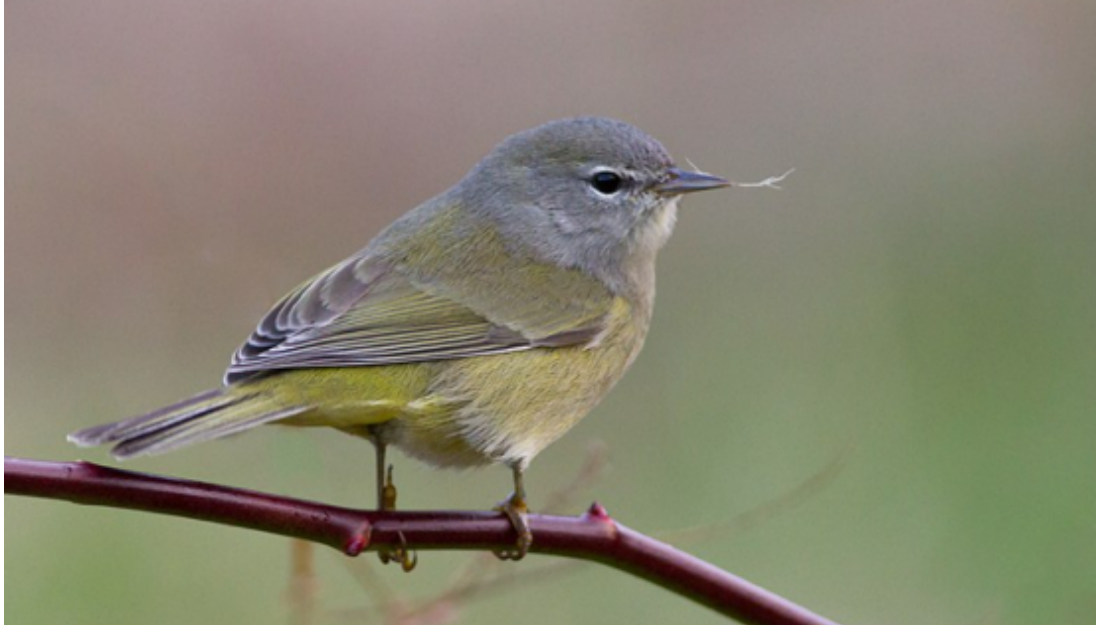
Paruline verdâtre.

L'automne, l'aspect général de cet paruline est un peu plus bleuté , particulièrement la tête , mais les sous-caudales restent toujours jaunes , ce qui reste le principal critère d'identification. La tête bleue avec à la fois, un cercle oculaire (incomplet) et une bande sombre traversant l'oeil peut nous confondre avec la p. à joues grises (qui, elle possède un cercle oculaire complet, sans bande sombre) ou la P. obscure (qui pour sa part, ne possède pas de cercle oculaire mais seulement une bande sombre sur l'oeil).