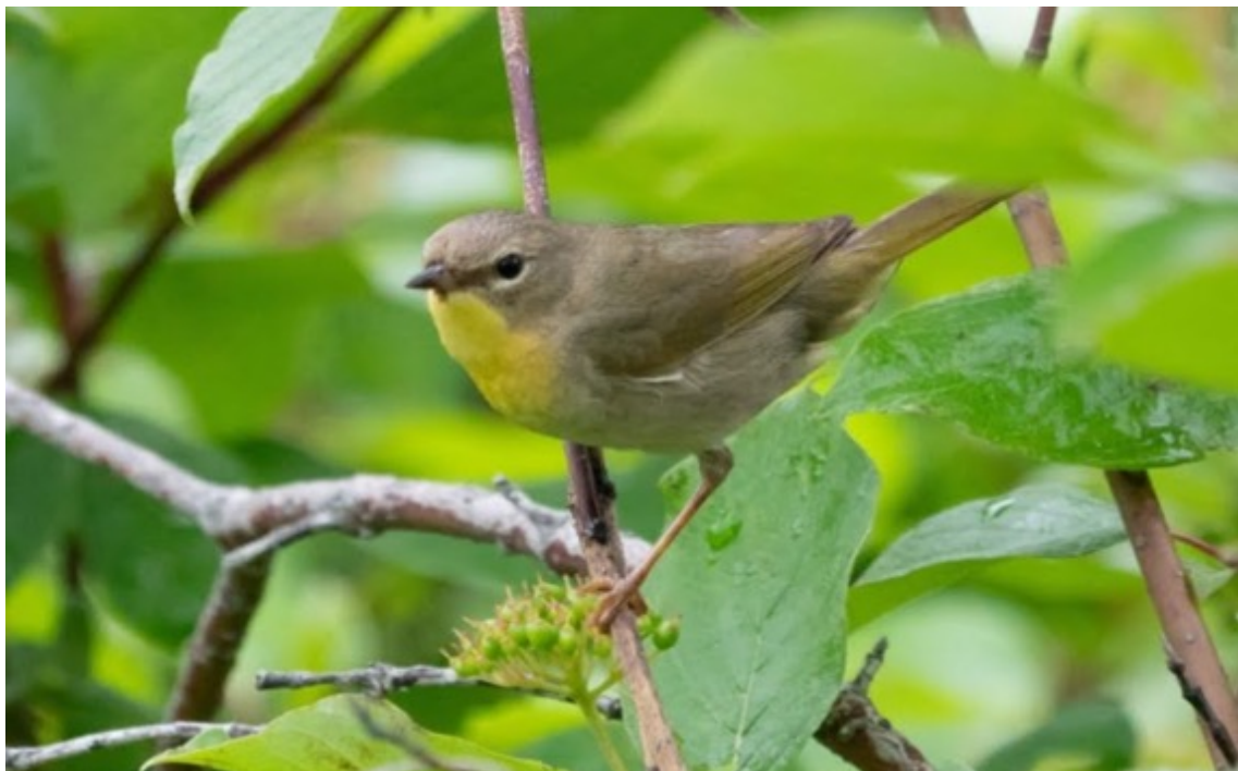
Paruline masquée

Femelle et jeune justifient un motif uni , au dos vert olive, avec la gorge et le haut de la poitrine jaunes , dégradant rapidement au beige sur tout le ventre. C'est l'une des rares parulines avec des sous-caudales jaunes . Le jaune de la gorge se découpe nettement avec les joues olive. Le mâle peut avoir un début de masque noir. Même en automne, elle s'observe bas dans les fossés ou arbustes denses. Bec et pattes fortes.