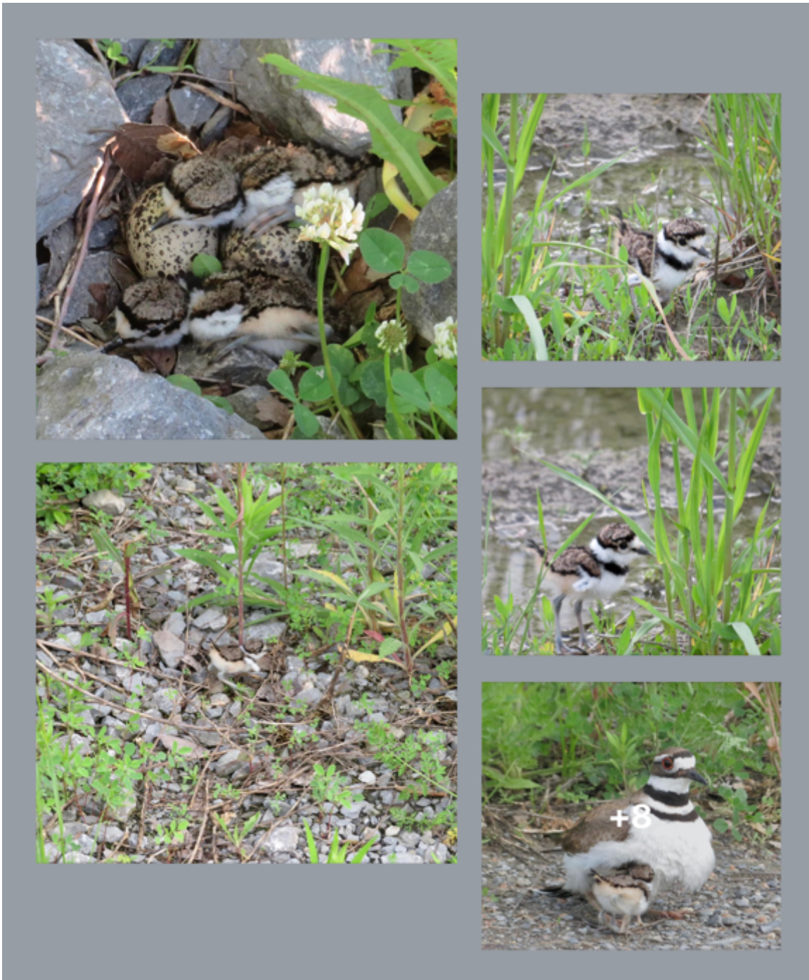
Région d'Ottawa / 2022-06-5