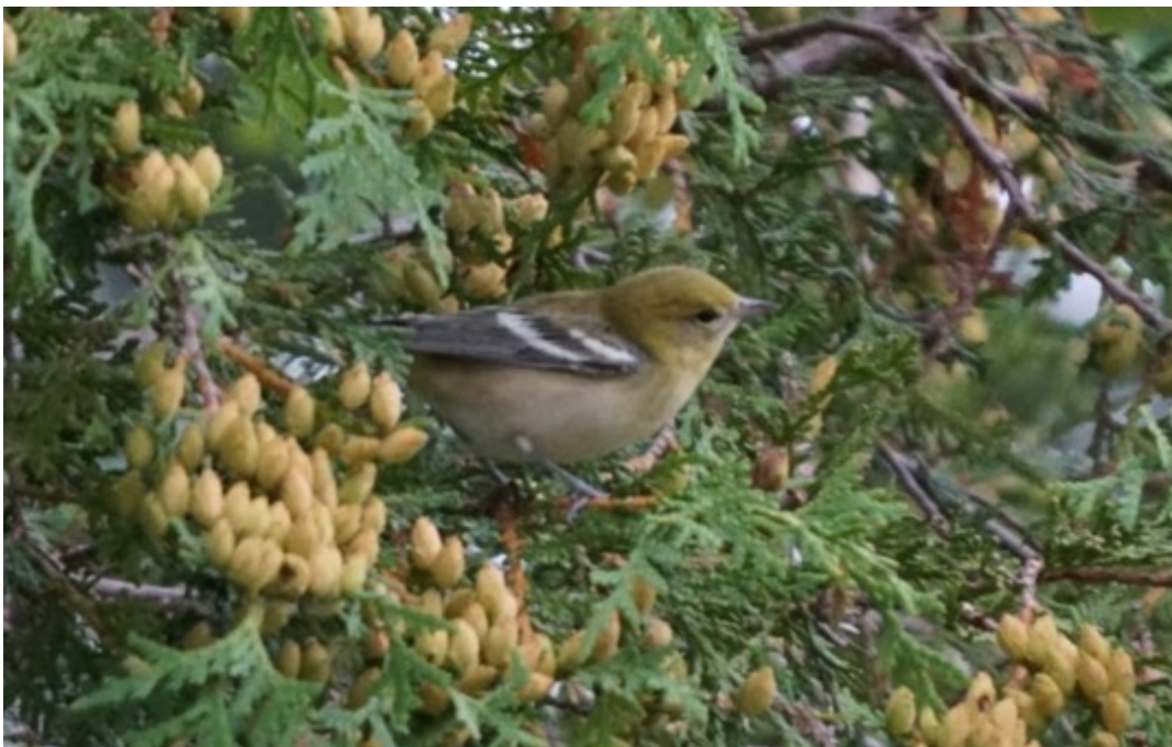
Paruline à poitrine baie

Ce sont donc 3 parulines jaunâtres , aux ailes foncées avec 2 barres alaires , une barre sombre qui traverse l'œil , un cercle oculaire incomplet, le sourcil pâle, le dos olive , le dessous pâle avec des teintes de jaune et des sous-caudales encore plus pâles.