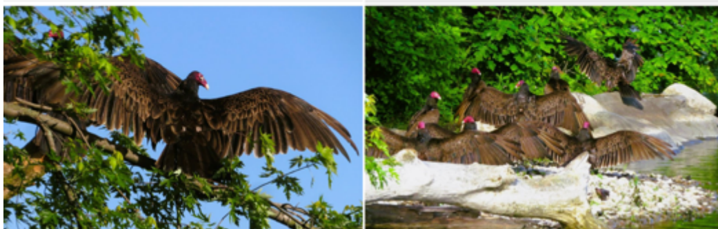
Ad Lib Go Oiseaux - 2022/06/11