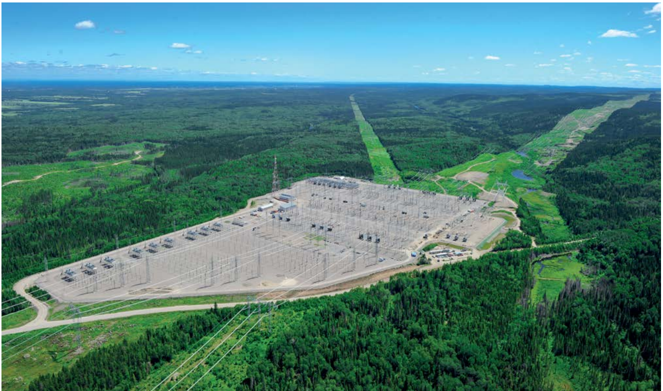
Poste de la Chamouchouane, au Lac-Saint-Jean, semblable au nouveau poste proposé