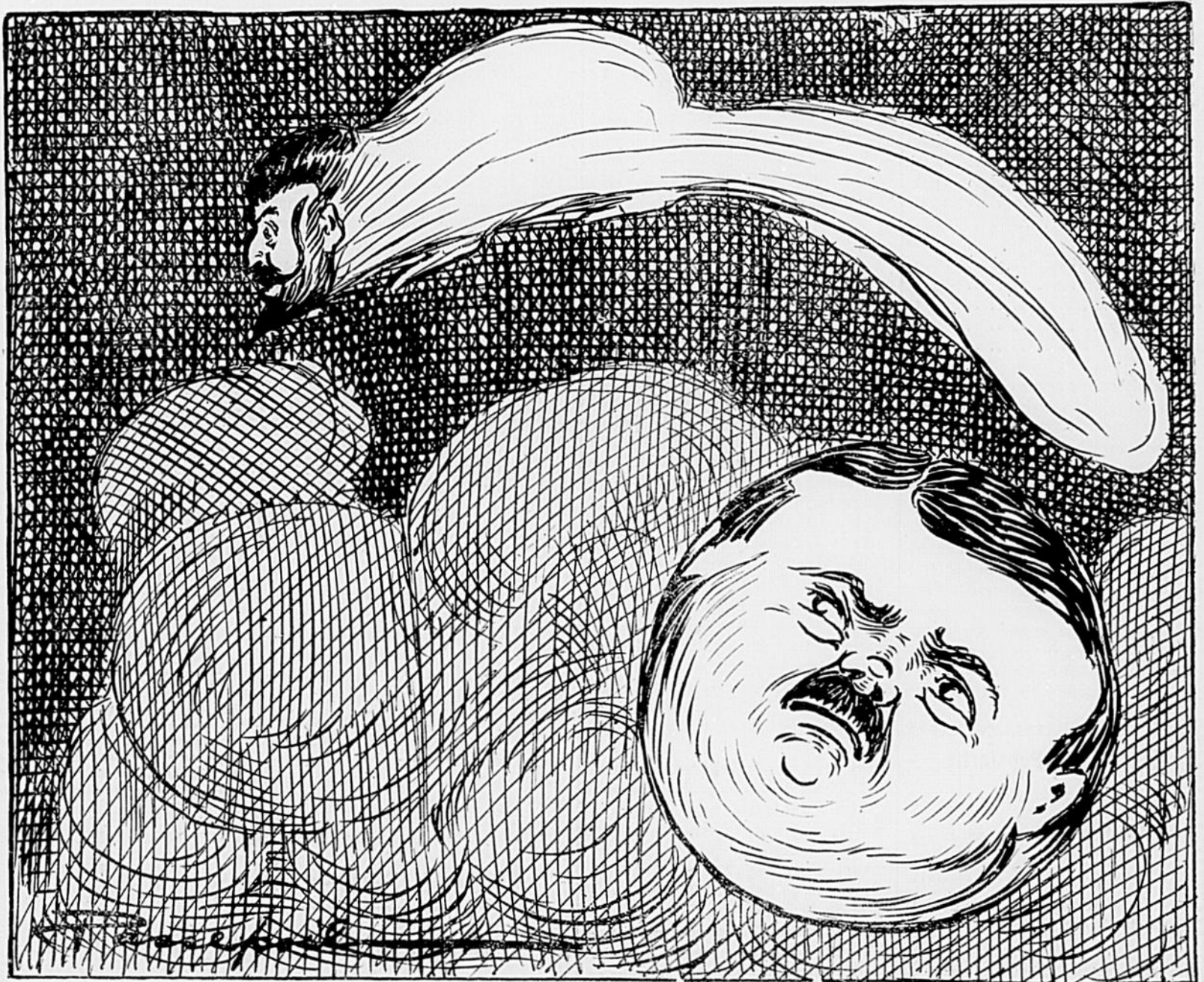
LA TERRE.— Décidément, les comètes y perdent à être vues de près. Je ne me pardonnerai pas d'avoir pris celle-là au sérieux.

NOTRE CARICATURISTE QUEBECOIS REO, A NON-SEULEMENT L'OEIL JUSTE, MAIS IL SAIT CROQUER DES RESEMBLANCES