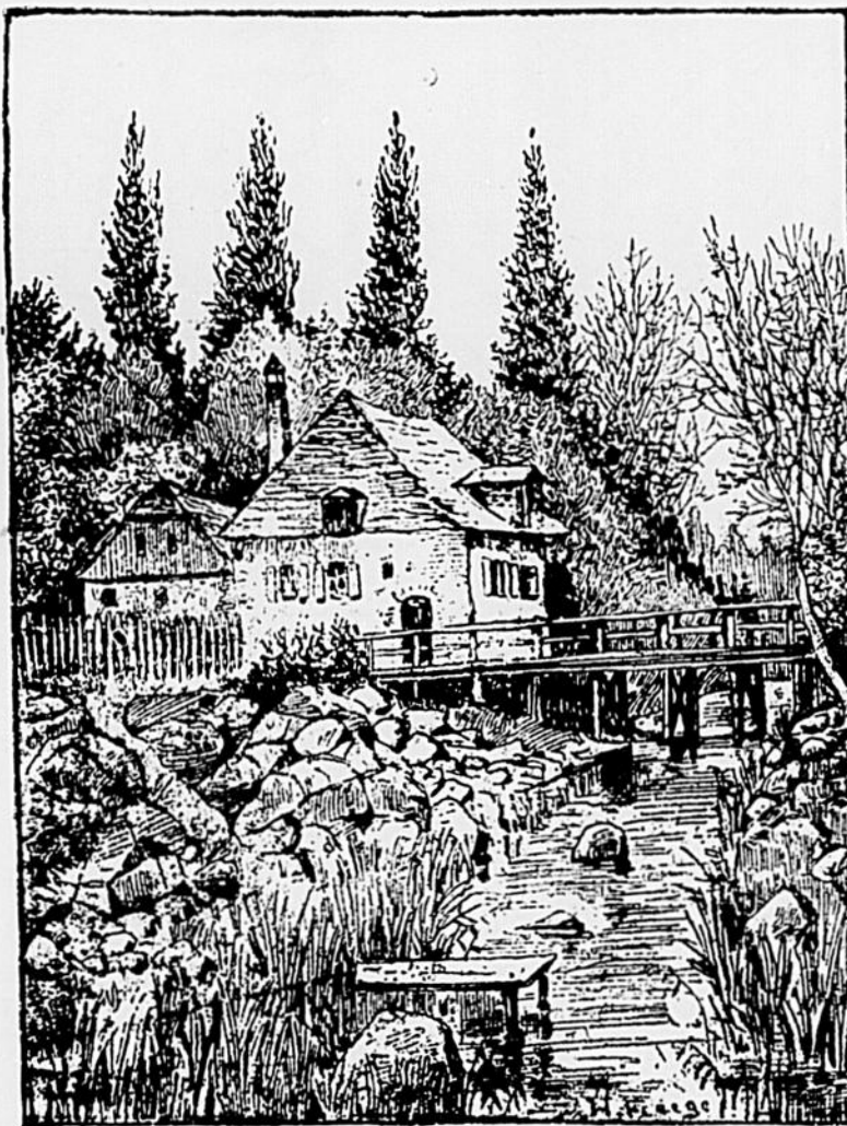
Où est le gardien du pont ? (Voir dernière page.)