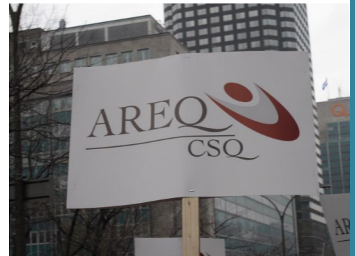
Nos partenaires de l'Association des retraités de l'enseignement du Québec (AREQ) étaient présents.