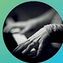
Espace Piano Blanc 2020