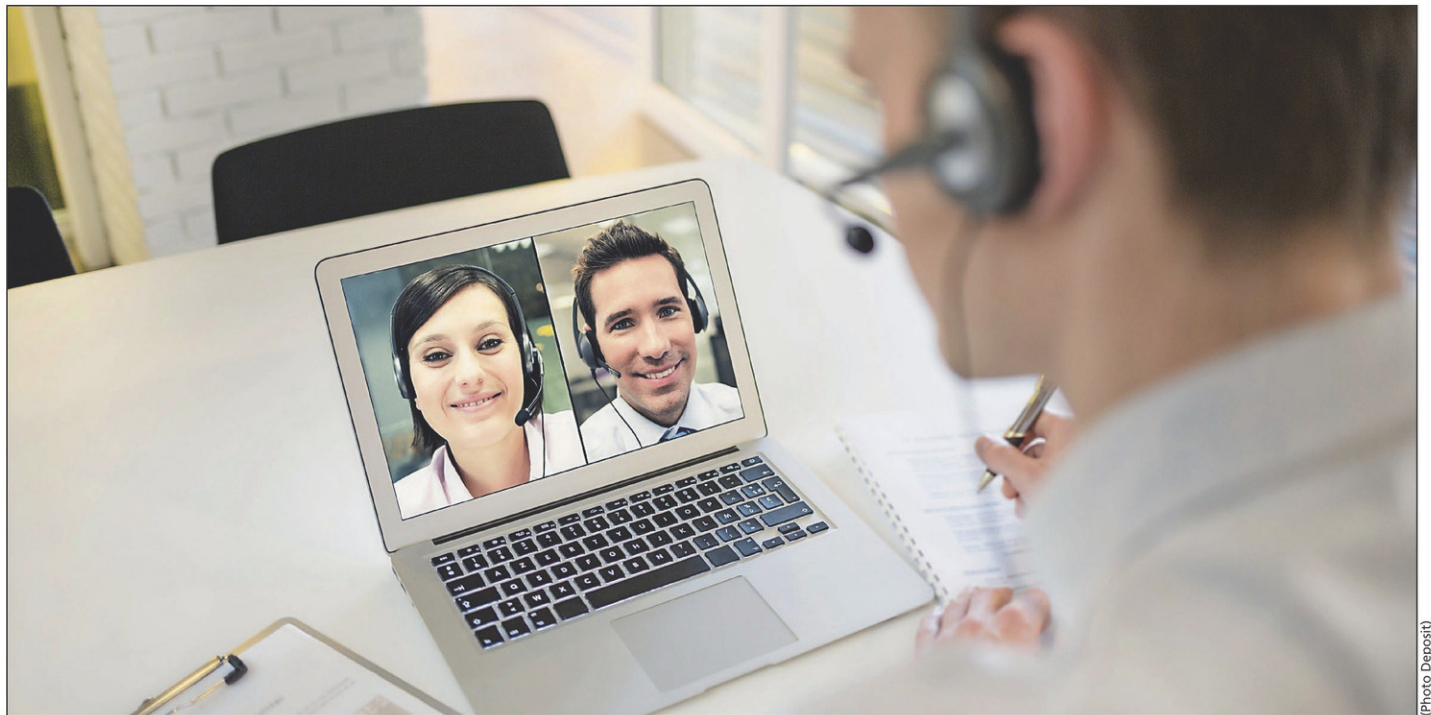
Un nombre croissant d'employés sont d'avis que le travail hybride a eu un impact positif sur leur équilibre entre vie professionnelle et vie personnelle.

Pourtant, 61 % des employeurs interrogés ont déclaré qu'ils ont mis en place ou prévoient de mettre en place un nombre obligatoire de jours au bureau par semaine