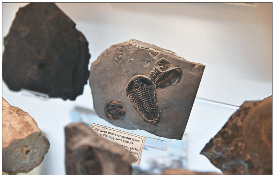
Le Pavillon Découvertes est ouvert les vendredis, samedis et dimanches, entre 16 et 21 heures, en même temps que la nouvelle activité Féerie du Parc Safari.