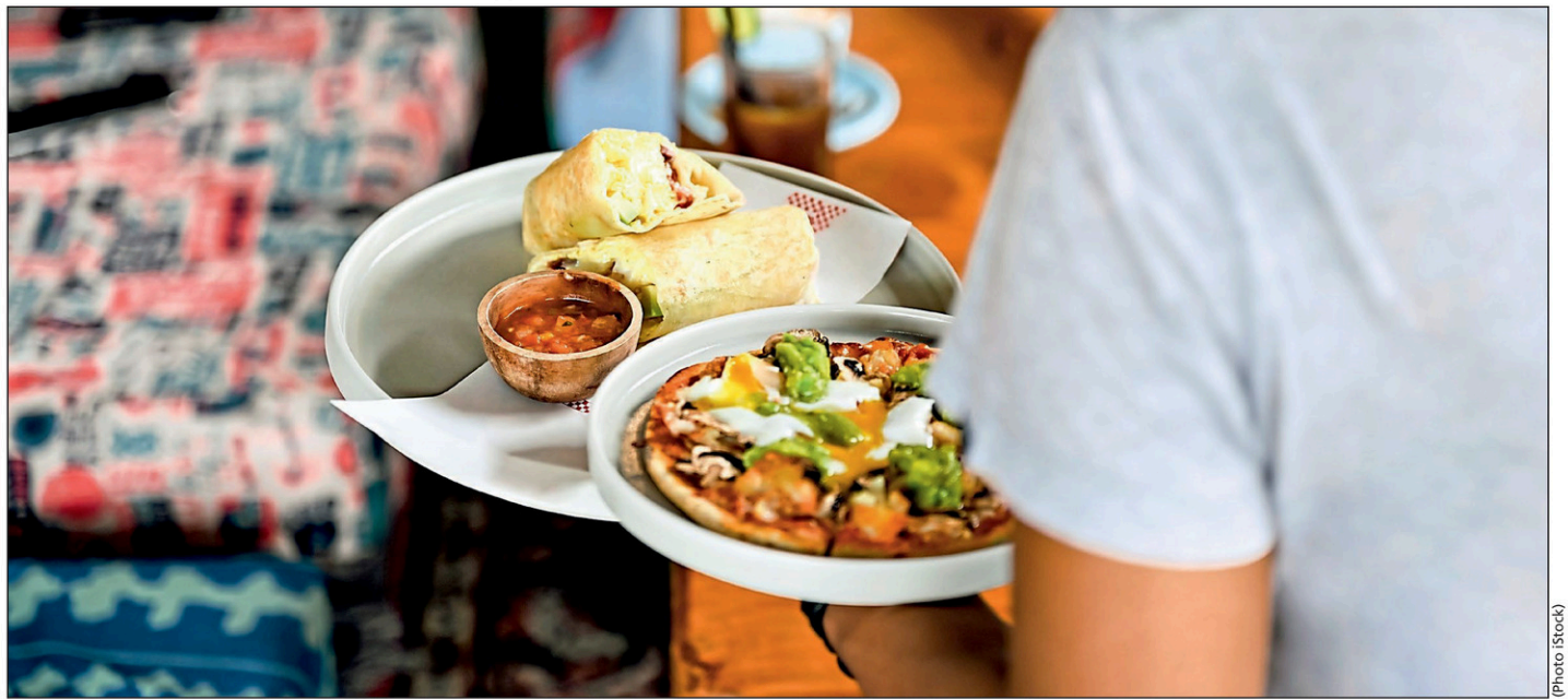
Les salariés rémunérés au pourboire verront le salaire minimum payable augmenter de 0,80 $. Il s'établira à 12,20 $.

minimum « permettra de maintenir, pour la période 2023-2024, la cible d'un ratio de 50 % entre le taux général du salaire minimum et le salaire horaire moyen tout en tenant compte de l'évolution du contexte économique », écrit le ministre du Travail dans un communiqué de presse.