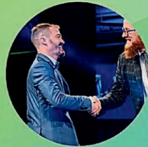
Coiffure Signé M 2019