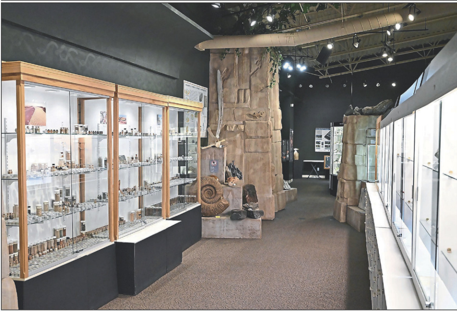
Parmi les nombreuses activités offertes au Parc Safari, les visiteurs peuvent visiter le Pavillon Découvertes situé tout près de l'entrée du site.