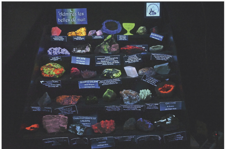
Certains minéraux ont aussi des propriétés leur permettant de briller dans le noir.