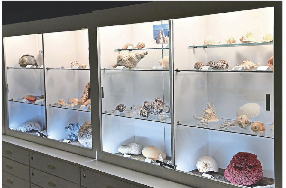
Sur la photo: une collection de coquillages variés provenant de nombreux pays.