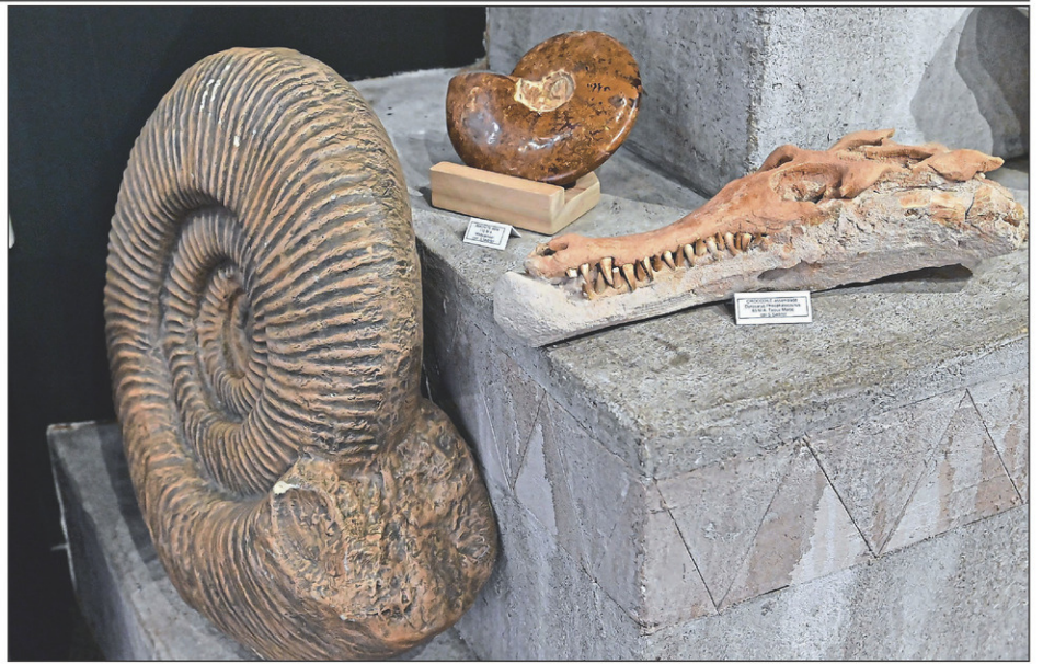
Le pavillon accueille une exposition intérieure portant sur l'évolution de la vie sur terre et les sciences naturelles.