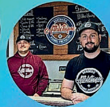
Boucherie Athlétique 2021