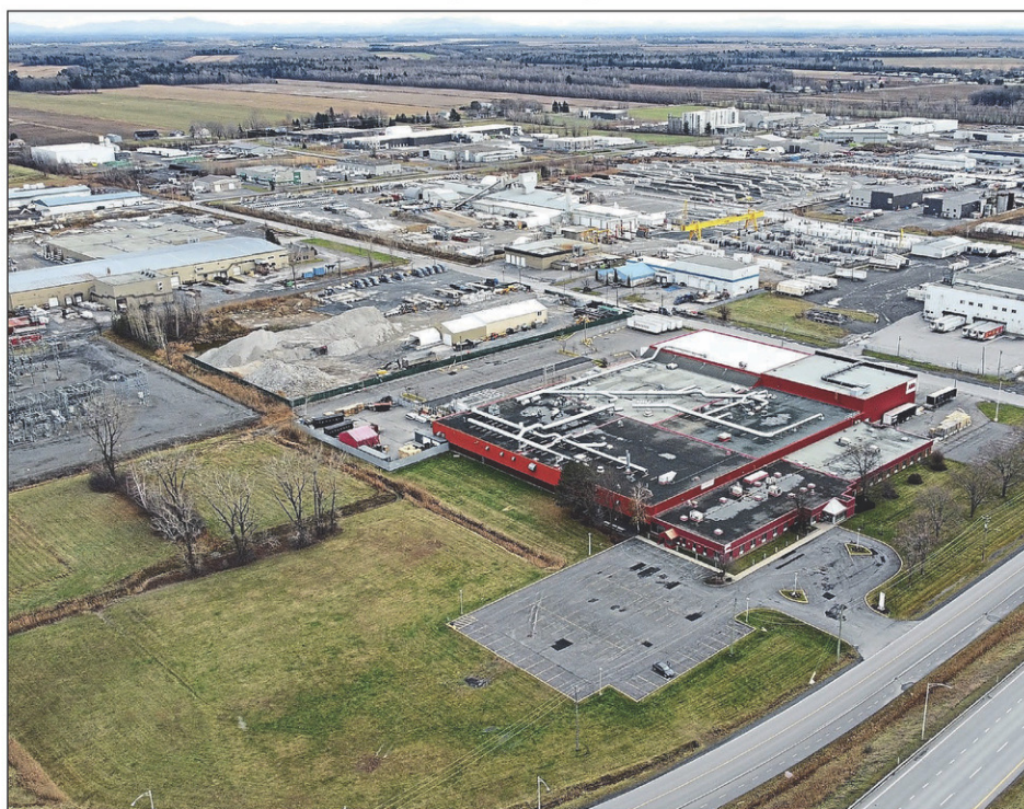
En raison de la faible capacité portante du parc industriel d'Iberville, le crédit de taxes est plus important pour les entreprises qui s'y établissent ou qui y réalisent un agrandissement.

Le programme procure une aide financière par un crédit de la taxe foncière générale aux entreprises manufacturières qui s'établissent en territoire johannais et qui créent une moyenne de 25 nouveaux emplois par 9000 mètres carrés ou « un nombre d'emplois au prorata de