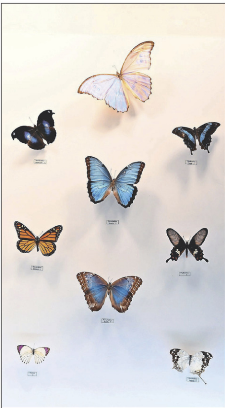
Parmi les 100 insectes exposés, on peut voir quelques espèces de papillons aux magnifiques couleurs.