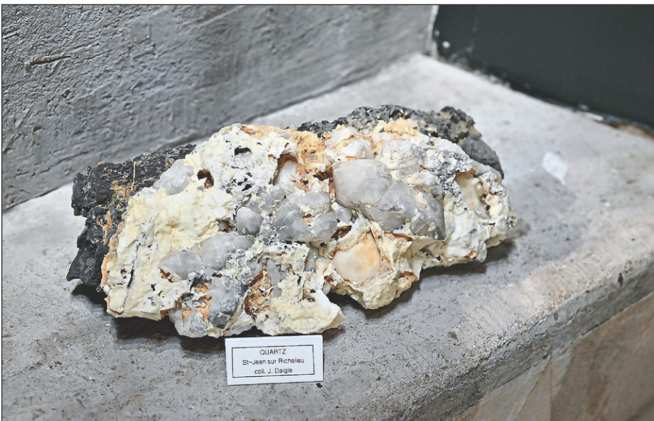
Cette impressionnante exposition comprend aussi des minéraux de Saint-Jean-sur-Richelieu, comme cet imposant quartz.