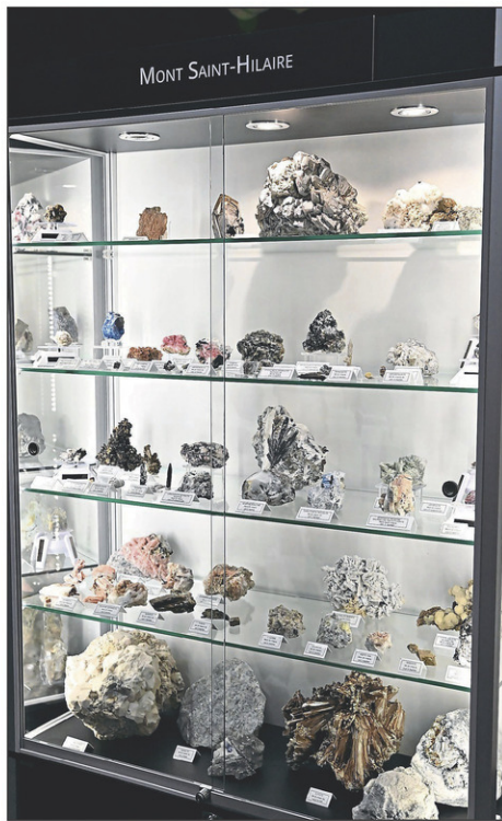
L'exposition comprend plus de 600 minéraux, 200 fossiles, 100 insectes et quelques centaines de sables et coquillages provenant de partout à travers le monde. Sur la photo, des espèces minérales du mont Saint-Hilaire.