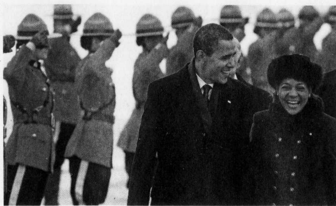
Le président Obama a été accueilli par la gouverneure générale du Canada, Michaëlle Jean, avec qui il a en commun d'avoir été le premier chef d'État noir de son pays. La chimie a eu l'air de fonctionner immédiatement, les deux souriant à belles dents.