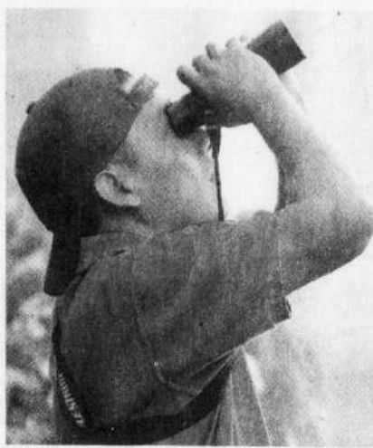
Selon la société Audubon, la migration nordique touche 58 % des espèces d'oiseaux observées.

C'est la sauvagine qui semble accroître le plus son aire hivernale, un accroissement qui dépasse 300 km dans le cas du canard noir, par exemple. Mais à plus long terme, note la Audubon, cette espèce ne va pas y gagner au change car le réchauffement du climat implique un assèchement