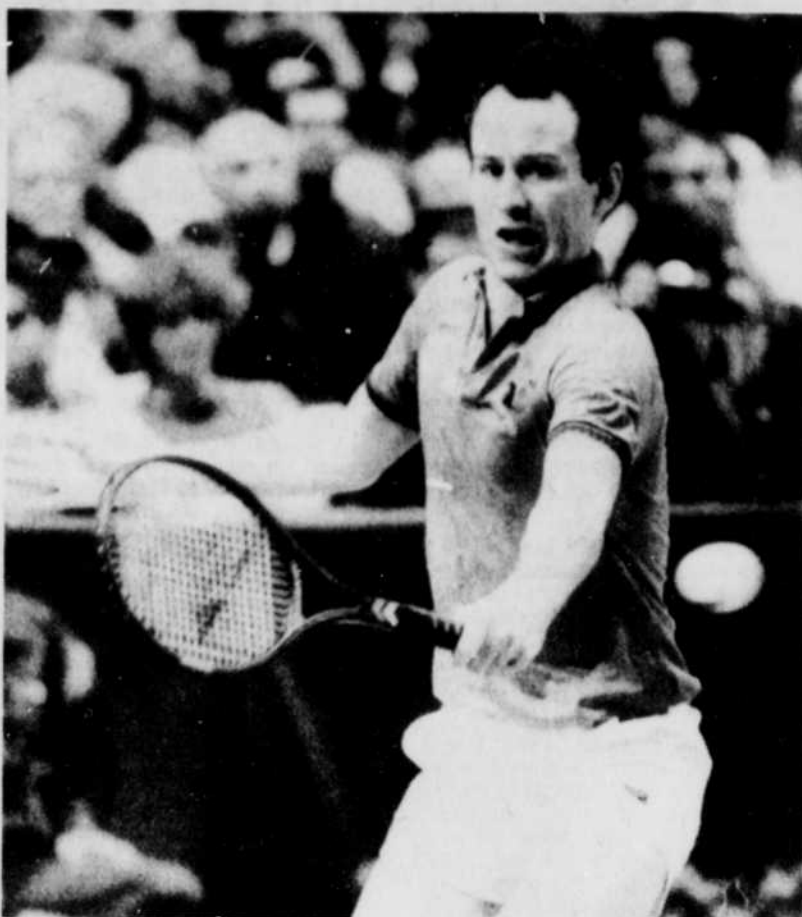
John McEnroe n'a fait qu'une bouchée de Lendl hier en finale du tournoi des Maîtres.

Cependant c'est sa domination sur l'ensemble du court, et pas seulement son service, qui explique sa victoire et sa supériorité sur Lendl.