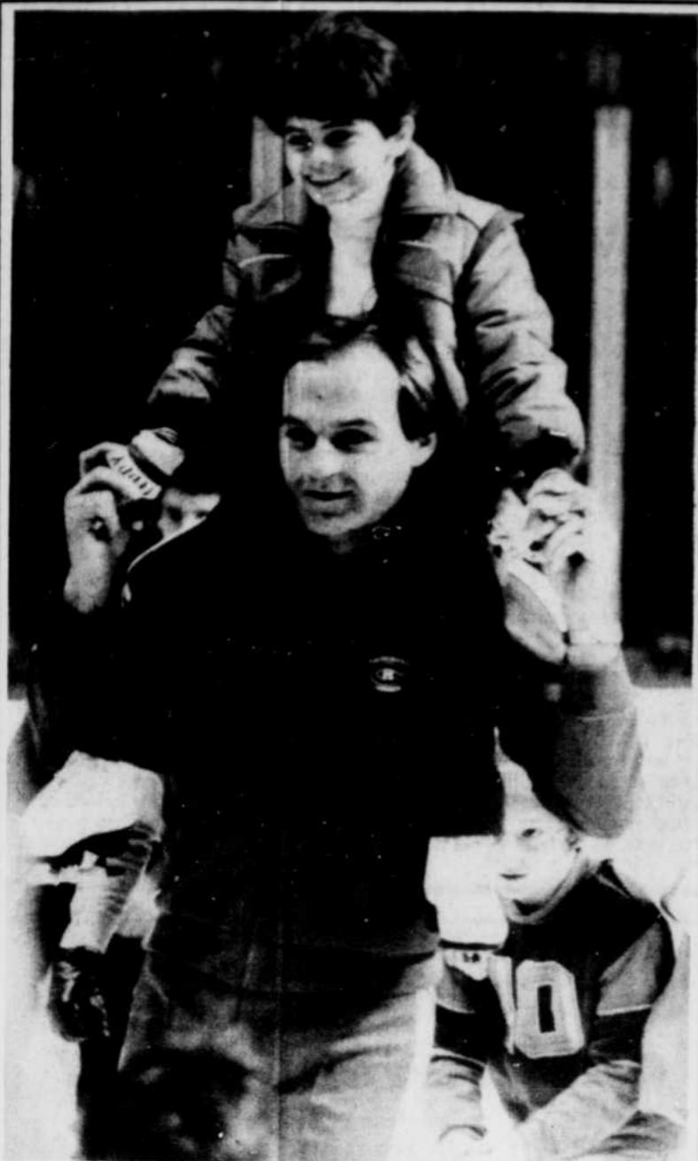
Guy Lafleur fut très occupé hier sur la patinoire du Forum.