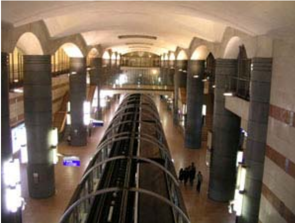
Station de métro - Bibliothèque de Paris

Le métier de bibliothécaire a beaucoup changé depuis les dernières années et l'époque de la gentille dame avec son classeur et ses lunettes est de plus en plus rare et révolue. Aujourd'hui, le bibliothécaire est devenu un technicien en communication informatique . Cela commence à créer un manque de personnel qualifié car les diplômés en informatique préfèrent les firmes spécialisées où le salaire est plus élevé que dans une librairie publique. La bibliothèque moderne est devenu à la fois un café-internet, une garderie pour adultes et enfants et une salle pour étudier.