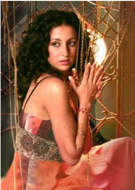
La chanteuse Lynda Thalie