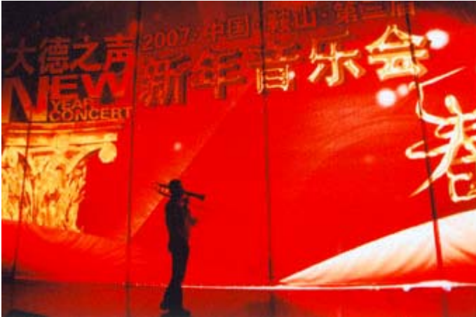
Musique en Chine