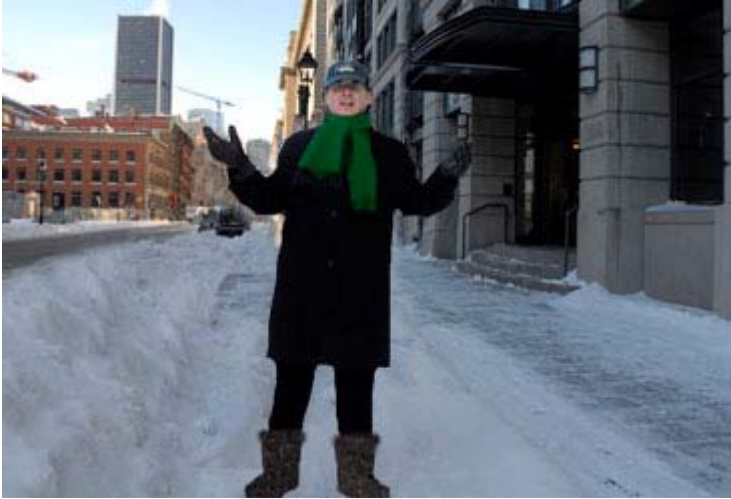
L'éditeur aux prises avec la neige...