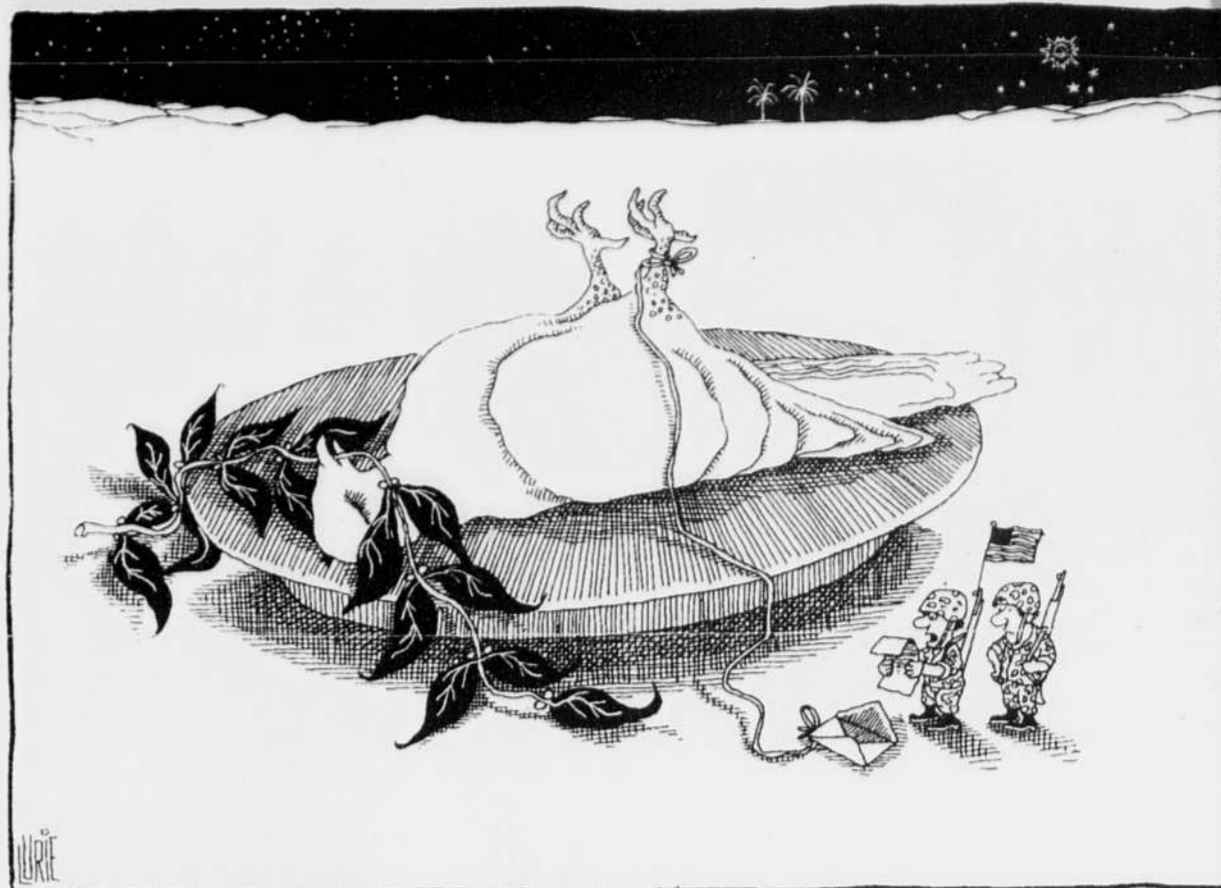
C'est écrit: Voilà votre volaille pour la Thanksgiving — et c'est signé: Saddam Hussein

M. Levesque affirme qu'en dépit de l'harmonisation avec le fédéral, son gouvernement a conservé sa pleine autonomie sur le plan fiscal. Il a ici une très bonne occasion de le démontrer, et d'exercer cette autonomie contre l'appauvrissement intellectuel.