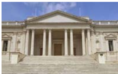
La British School at Rome