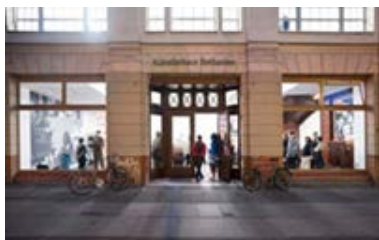
La Künstlerhaus Bethanien

Le Studio du Québec à Rome a changé d'appartement mais reste au sein du même immeuble situé au coeur d'un des points cardinaux de la culture mondiale. En effet, c'est dans la Ville Éternelle que l'on retrouve la plus grande concentration d'académies, d'associations, centres et instituts culturels étrangers au monde. Depuis 2001, 22 artistes et écrivains québécois ont séjourné dans le Studio du Québec à Rome. La liste des boursiers et les photos du nouveau studio se trouvent sur la page qui lui est consacrée sur le site Web du CALQ.