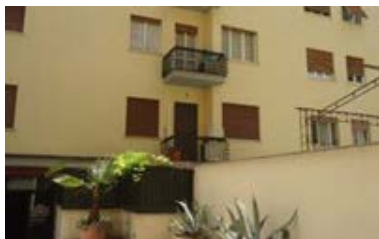
Le Studio du Québec à Rome